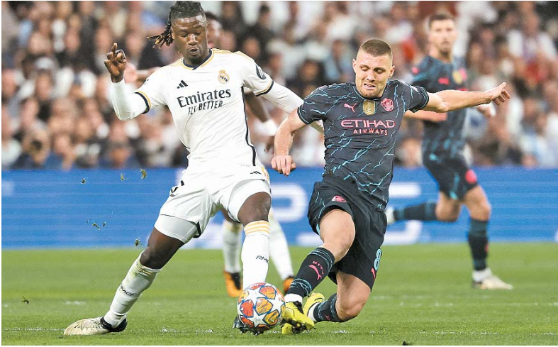
Real e Manchester City empataram em 3x3 no Santiago Bernabéu

Futebol assume protagonista em meio a ameaças terroristas, e Liga dos Campeões abre quartas de final com jogos emocionantes, deixando tudo em aberto