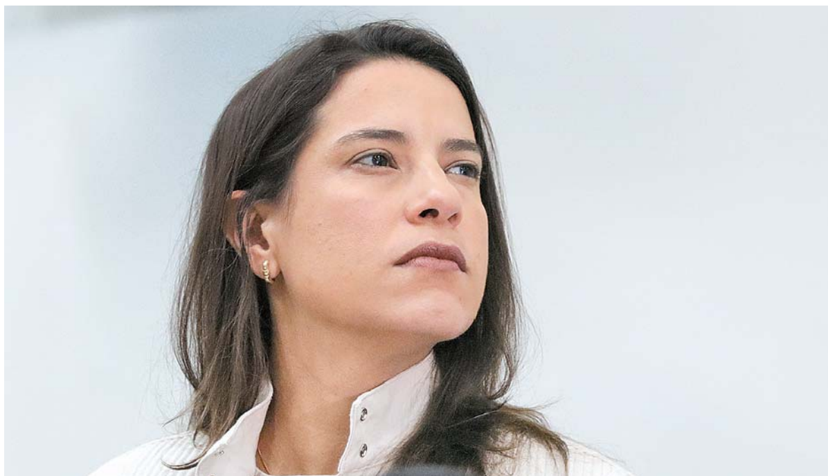
Gestora ressaltou que matéria garante aumento para servidores, priorizando quem ganha menos