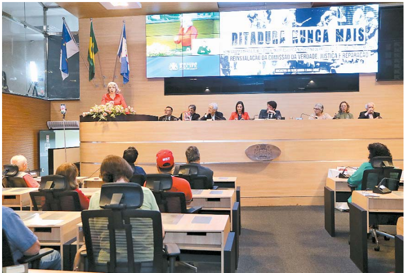
Câmara de Vereadores Recife fez homenagem in memoriam

Liana, em seu discurso, relembrou o episódio da tortura de Gregório Bezerra, dirigente do Partido Comunista Brasileiro, por militares, na Praça de Casa Forte, no dia 2 de abril de 1964. Segundo a vereadora, foi ao assistir a cena que Mércia assumiu um compromisso com os direitos humanos e com a democracia: o de defender aqueles que lutavam contra a ditadura.