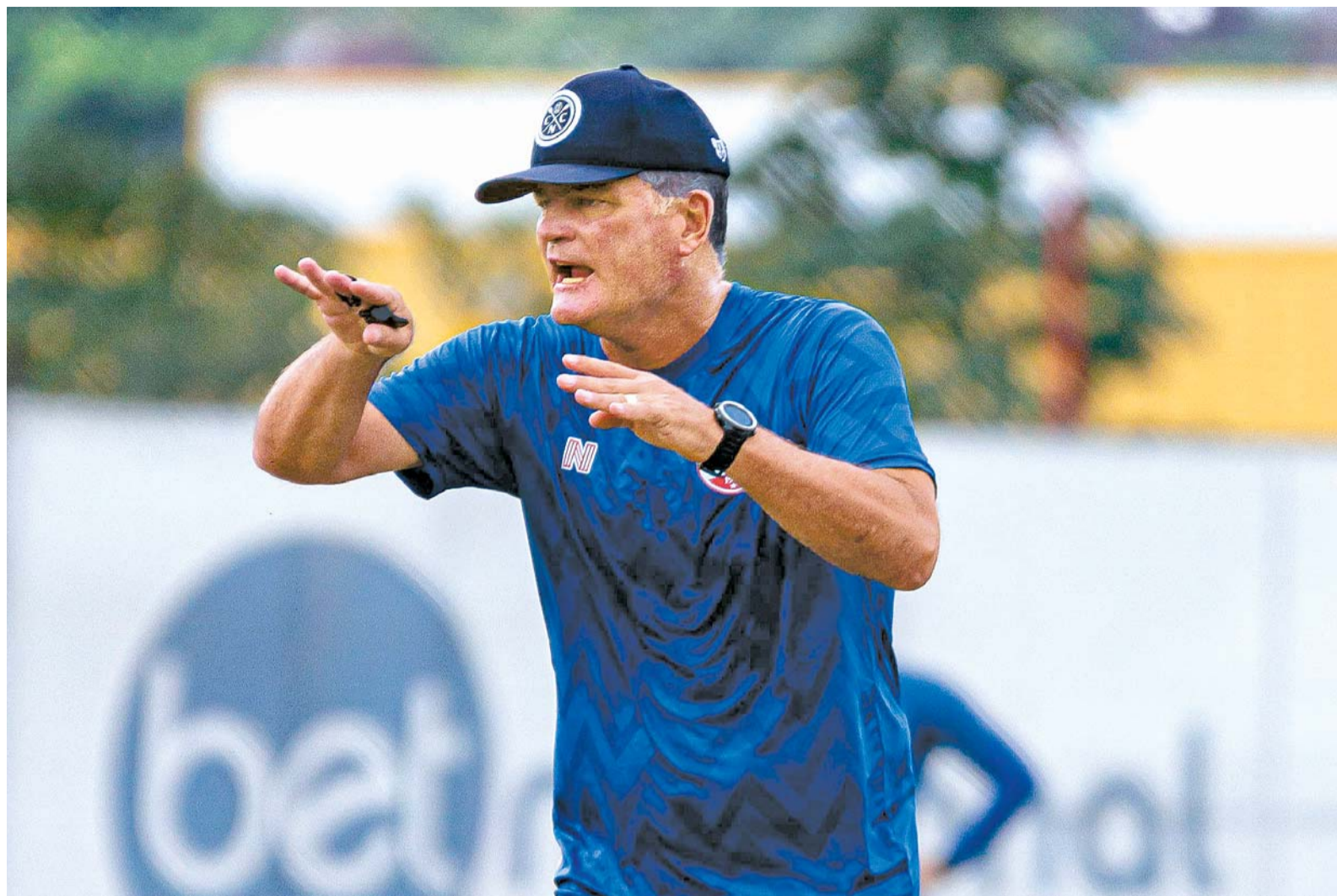
Pela previsão de Mazola, Timbu estaria mais próximo de desempenho ideal a partir da quarta rodada da Série C