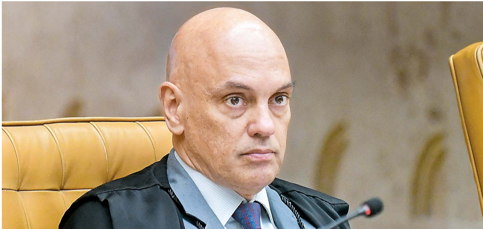
Musk tem feito uma série de ataques a Moraes, acusando o magistrado de censura e ameaçando descumprir decisões judiciais

Para a PF, a suposta milícia digital investigada no STF passou a atuar fora do território brasileiro para burlar ordens judiciais e difundir desinformação para obter a aderência de parte da comunidade internacional.