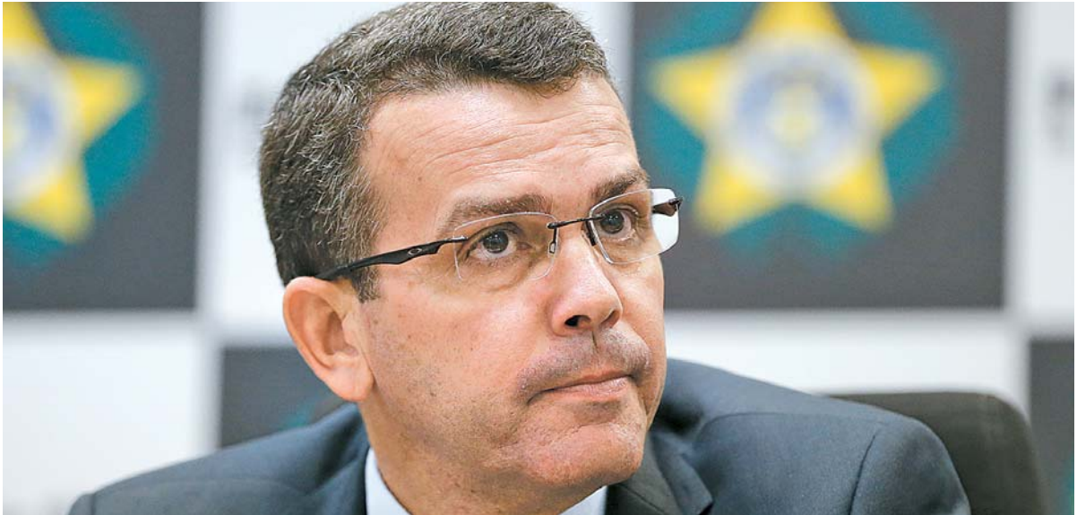
Ex-chefe de polícia está preso há um mês e pediu a Moraes para ser ouvido com sua esposa

“A parceria com o senador Fernando Dueire é essencial para o progresso de Serra Talhada”, destacou a prefeita. “Tenho certeza que a iniciativa impulsionará o desenvolvimento local e melhorará a qualidade de vida dos cidadãos”, acrescentou.