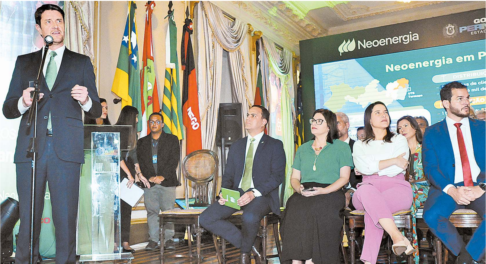
O novo planejamento estratégico da empresa foi divulgado ontem (29) durante evento no Palácio do Campo das Princesas