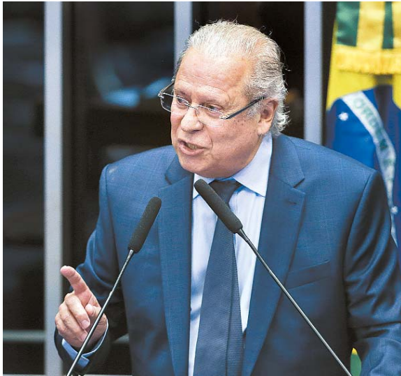
Ex-ministro quer vaga na Câmara em 2026

tigações e ações penais. "O que poderia e deveria ter sido feito na forma da lei para combater a corrupção foi realizado de maneira clandestina e ilegal", justificou Toffoli. Ao declarar a "nulidade absoluta de todos os atos processuais" contra Marcelo Odebrecht na Lava Jato, o ministro determinou que os inquéritos e processos envolvendo o empresário sejam trancados.