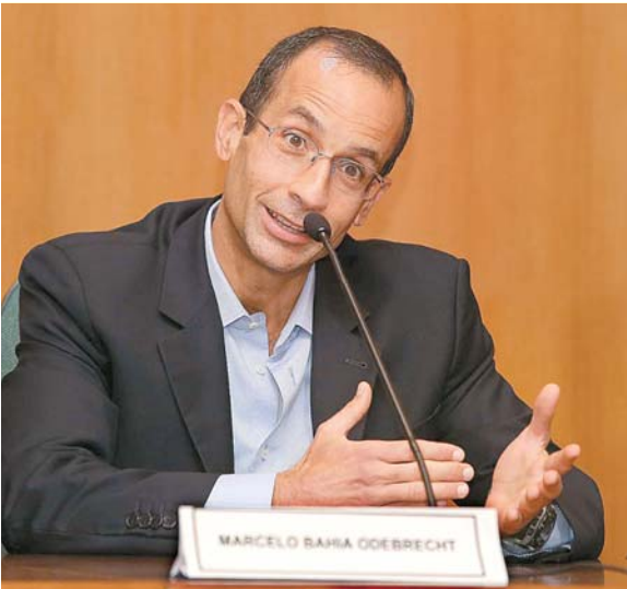
Empresário fechou acordo de colaboração

ESTADÃO CONTEÚDO O ministro Dias Toffoli, do Supremo Tribunal Federal (STF), derrubou, ontem (21), todos os processos e investigações contra o empresário Marcelo Odebrecht na Operação Lava Jato. A decisão afirma que houve “conluio processual” entre o ex-juiz Sérgio Moro e a força-tarefa de Curitiba e que os direitos do empresário foram violados nas inves-