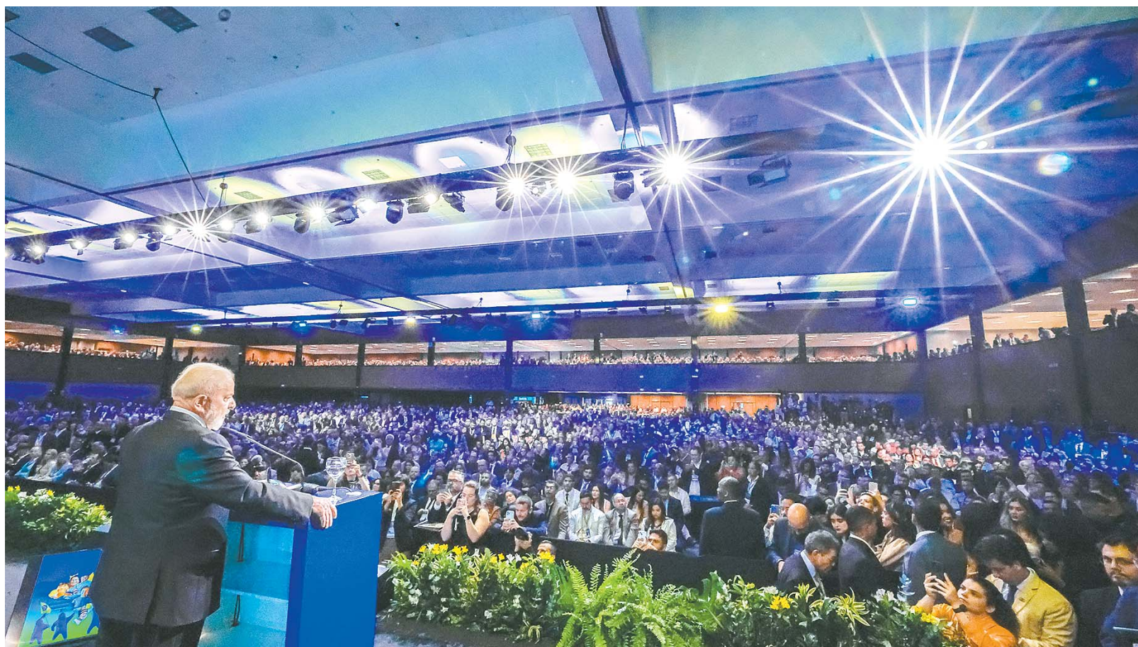
Proposta tem sido defendida pela Confederação Nacional de Municípios (CNM), durante a Marcha dos Prefeitos, em Brasília

municípios a maior parte das obrigações e que esse ponto precisa ser revisto. “Não é possível tomar decisão política em nível nacional sem a gente medir a consequência dela quando a gente chega na ponta da cidade. Nós transferimos muita responsabilidade e muitas vezes a gente precisa transferir parte do dinheiro junto para o prefeito cumprir. Grande parte das coisas que os prefeitos reivindicam é justa. Precisamos estabelecer uma relação digna e respeitosa entre nós”, afirmou.