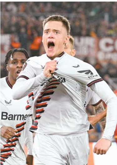
Florian Wirtz, do Bayer, comemora gol contra a Roma

Agora, a equipe de Daniele De Rossi está na corda bamba e vê o sonho da terceira final europeia consecutiva se distanciar, depois de vencer a decisão da Conference League em 2022 contra o Feyenoord e de perder a final da Liga Europa no ano passado para o Sevilla.