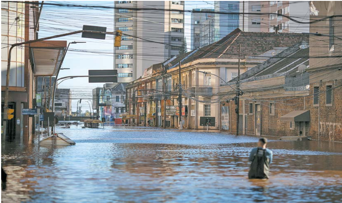
Porto Alegre viu o Lago Guaíba aumentar seu nível em 21 centímetros nas últimas 24 horas

Fechado desde o começo do mês por conta da inundação que atinge Porto Alegre, no Rio Grande do Sul, o Aeroporto Internacional Salgado Filho, localizado na capital gaúcha, não deverá ser reaberto antes de setembro. A in-