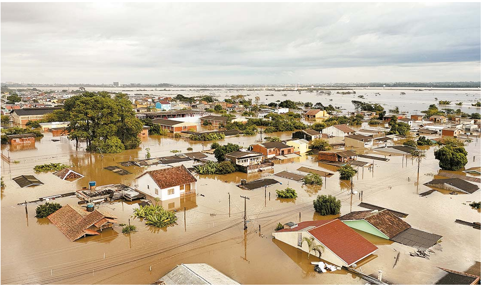
Vista aérea de um dos bairros mais atingidos de Porto Alegre que mostra os efeitos das enchentes na capital gaúcha

Ao obter o reconhecimento do Governo Federal da calamidade pública, o Estado consegue maior agilidade nas ações de auxílio federal de resposta e reconstrução. Além disso, o governo pode adotar medidas administrativas para o processo de contratação de bens e serviços necessários para socorrer a população e recompor serviços e obras de infraestrutura essenciais, sem necessidade de licitação. Também ontem, o prefeito do Recife, João Campos (PSB), anunciou a doação de 500 colchões,