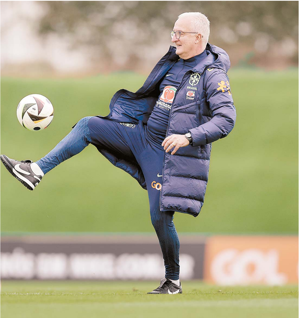
Técnico Dorival Júnior vai anunciar convocados para amistosos pré-Copa América na sexta-feira

Dia 25 nova viagem. A seleção embarca para Las Vegas, já mirando o Paraguai, no dia 28 de junho, no Allegiant Stadium. A despedida da fase de grupos será em Santa Clara, no Levi's Stadium, também na Califórnia, dia 2 de julho.