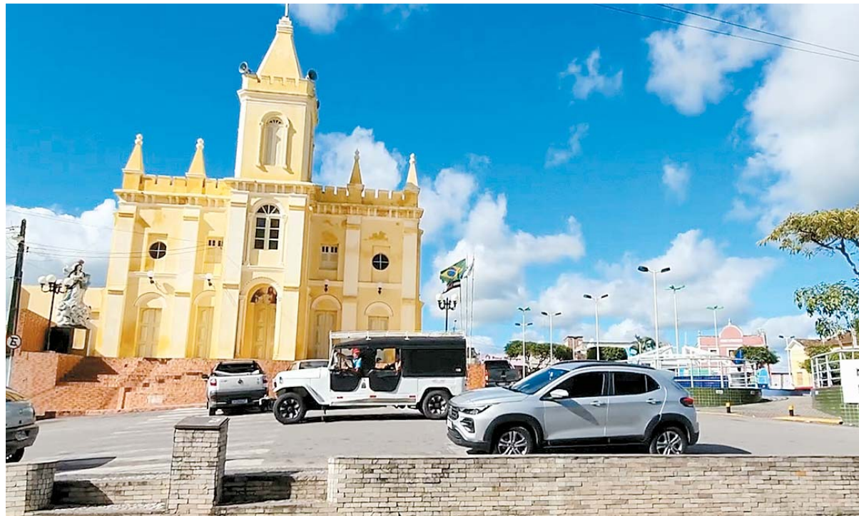
Com 21.808 habitantes, segundo último censo do IBGE, Orobó teve liberação de R$ 4,5 milhões