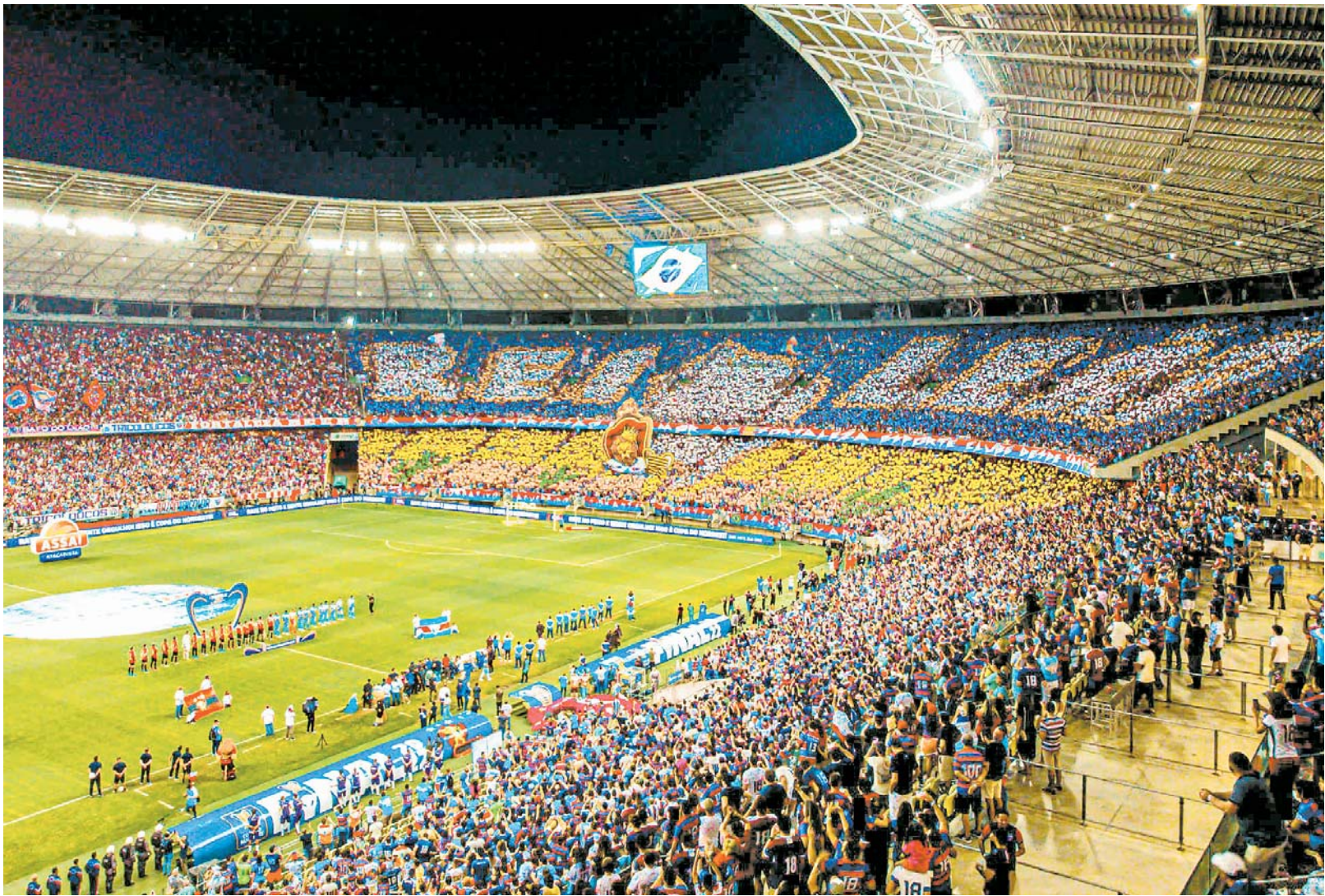
Castelão, casa do Fortaleza, será palco do primeiro jogo da final da Copa do Nordeste

firmaram presença no primeiro duelo. O Fortaleza só tem uma derrota na história em casa para o CRB, ocorrida em 2007, na Série B. Os alagoanos, porém, querem