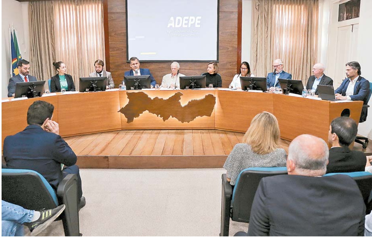
A reunião do Conselho que aprovou os novos projetos aconteceu ontem (4) na Adepe