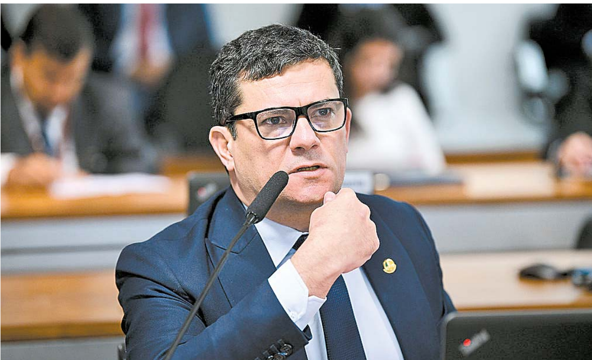
Por 5 votos a 0, Primeira Turma do STF aceitou denúncia da PGR contra o parlamentar

No início do julgamento, os ministros rejeitaram, também por unanimidade, um pedido da defesa de Moro para que o caso não fosse analisado no STF, já que o vídeo foi gravado antes de Moro tornar-se senador. A regra atual do foro privilegiado determina que só