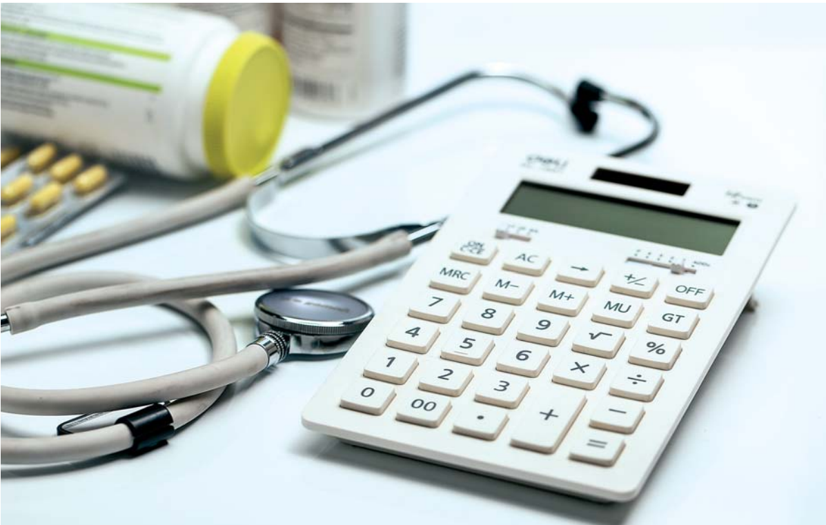
O reajuste foi divulgado ontem pela Agência e vale entre maio de 2024 e abril do próximo ano