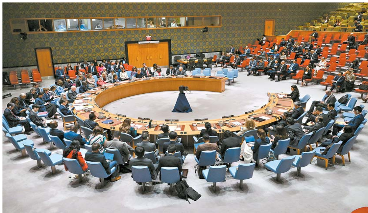
Resolução do Conselho de Segurança é a primeira que abre caminho para o fim da guerra

O rascunho final do novo texto rejeita qualquer tentativa de mudar o território ou a demografia de Gaza, ou reduzir seu tamanho,. Também reitera o "compromisso inabalável do Conselho de Segurança de alcançar a visão de uma solução negociada de dois Estados, onde dois estados democráticos, Israel e Palestina, vivem lado a lado em paz dentro de fronteiras seguras e reconhecidas".