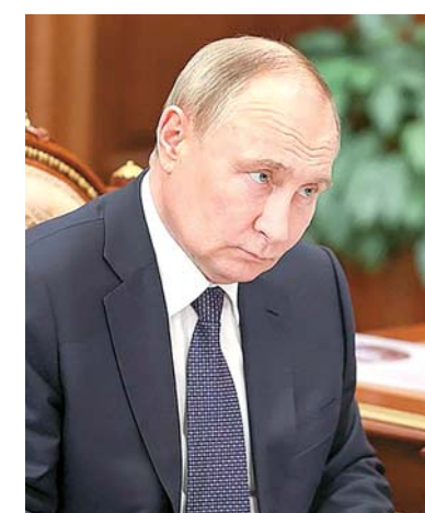
Presidente russo defende diálogo sobre o Brics e o G20

De acordo com o Planalto, "o presidente Lula reiterou a defesa de negociações de paz que envolvam os dois lados do conflito, em linha com documento assinado pelos assessores presidenciais Celso Amorim e seu homólogo chinês Wang Yi". De acordo com governo russo,