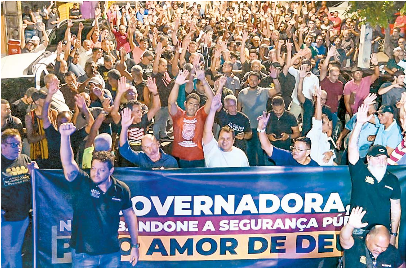
Policiais civis de Pernambuco votaram em maioria pela rejeição da proposta de reajuste salarial

Em nota, o Governo do Estado propôs uma “recomposição salarial para o quadriênio 2023/2026, garantindo que nenhum servidor terá