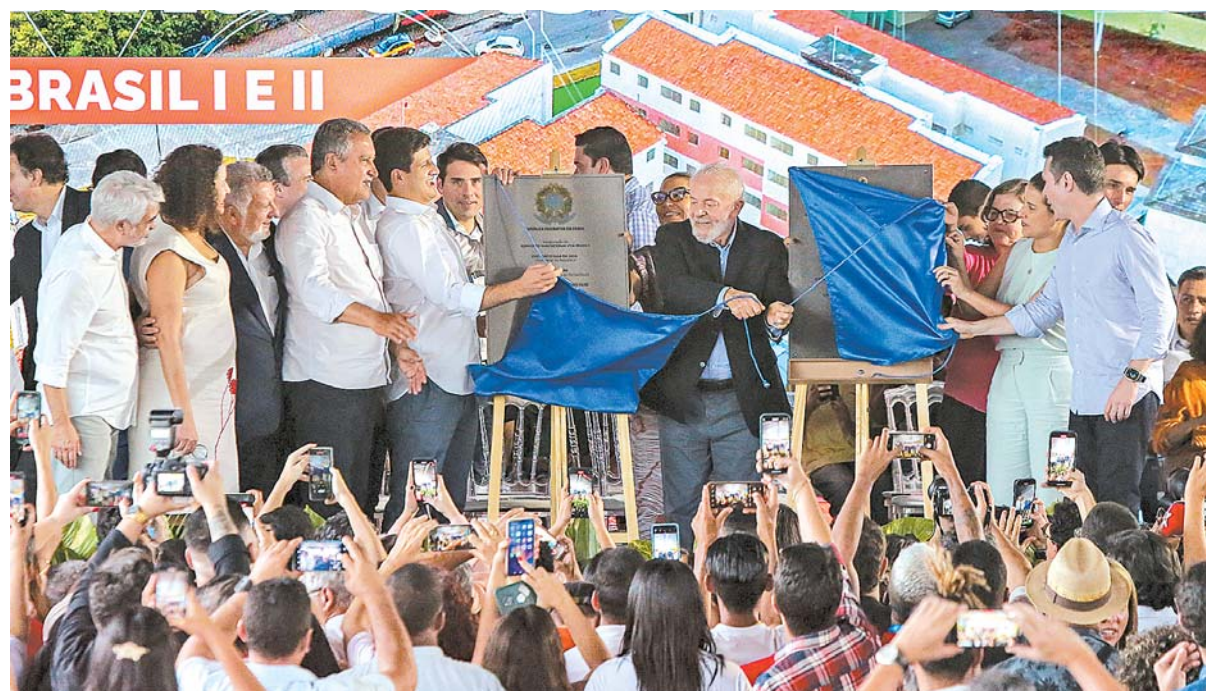
Durante evento, lideranças inauguraram os conjuntos habitacionais Vila Brasil I e II

na Bezerra, na área central da capital, os prédios têm 448 unidades e contemplaram 2 mil pessoas que moravam em habitações precárias e palafitas na comunidade do Papelo, às margens do Rio Capibaribe, no bairro dos Coelhos. As obras receberam investimentos da ordem de R$ 40 milhões, divididos entre município e União.