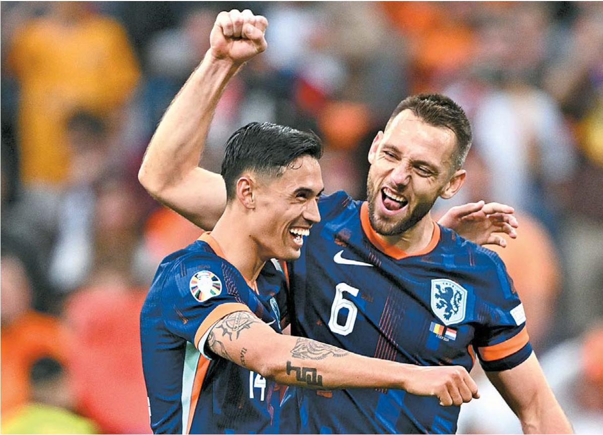
Holandeses levaram a melhor nas oitavas de final ao derrotarem a Romênia