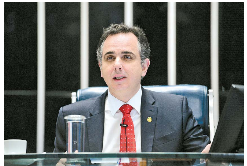
Rodrigo Pacheco deverá se reunir com ministro da Fazenda

Governadores se reuniram com presidente da Casa Alta para negociar taxa menor de juros de débito com a União. Também será debatida dívida dos municípios com a Previdência