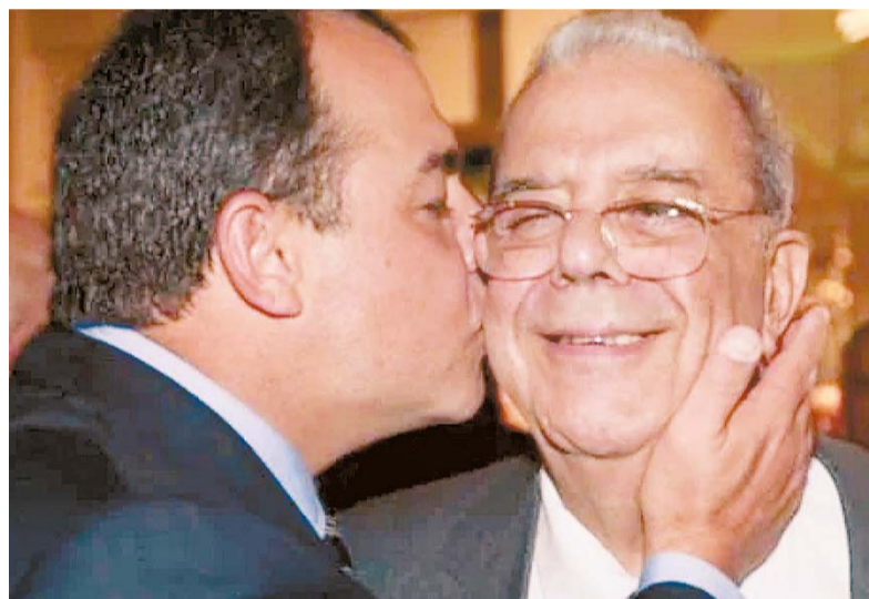
O ex-governador beija seu pai de quem carrega o nome