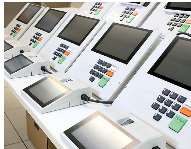
Projetos precisam ser homologados antes do teste nas urnas

O prazo para a realização das convenções começa neste sábado (20) e vai até o dia 5 de agosto. Atos oficializam candidaturas a prefeito e vereador