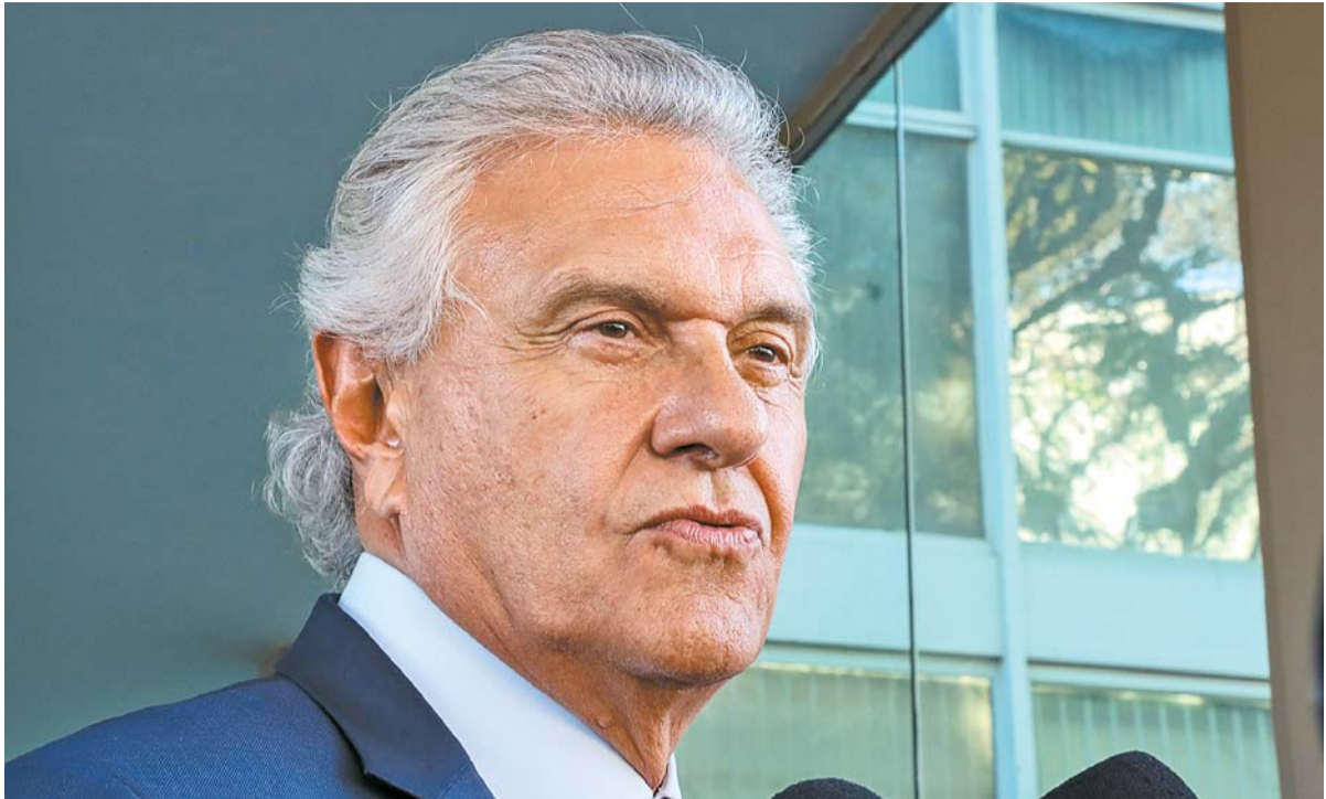
Gestor tem sido a voz política mais forte contrária ao projeto que tramita no Congresso

Caiado considerou ridícula uma situação, segundo ele, quando, em 1988, a Constituição estabeleceu que a taxa de juros não pode-