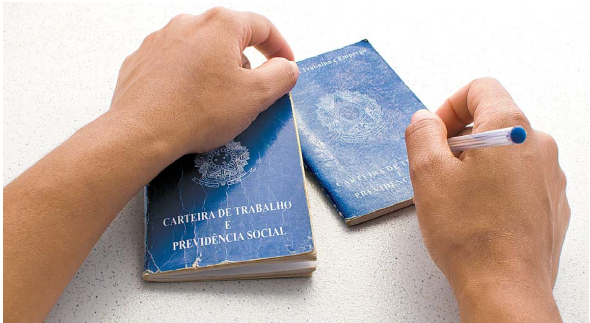
Os resultados do Caged levam em conta apenas as admissões e demissões na carteira de trabalho

De acordo com o Caged, os cinco grandes setores produtivos em Pernambuco tiveram saldo de empregos favorável no mês de junho deste ano. Mas o resultado foi puxado, principalmente, pelos setores de Serviços (com 3.920 novos postos), Comércio (1.498) e Indústria (1.442). Em seguida, ficaram a Agropecuária (645) e Construção (517). No âmbito nacional, foram 201.705 postos de trabalho criados em junho e 1,3 milhão de janeiro a junho de 2024.