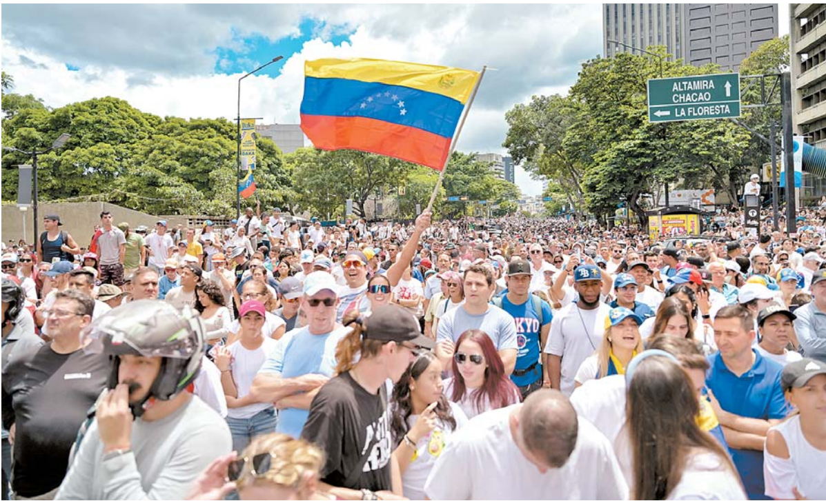
População protesta contra resultado do pleito presidencial e OEA diz não reconhecer resultado

O presidente Luiz Inácio Lula da Silva (PT) falou pela primeira vez, ontem (30), sobre o impasse na eleição presidencial na Venezuela, realizada no domingo (28). Lula disse que, para “resolver a briga”, é