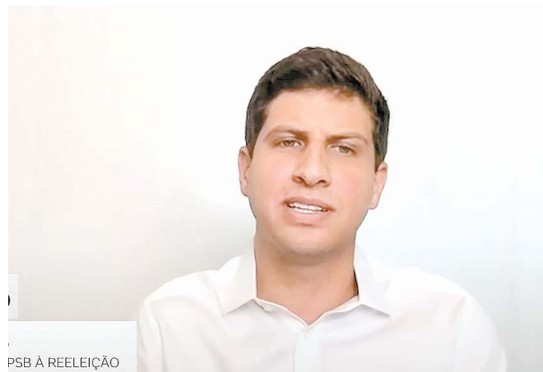
PSB À REELEIÇÃO

Gestor disse que seu foco é em 2024 e evitou falar sobre 2026