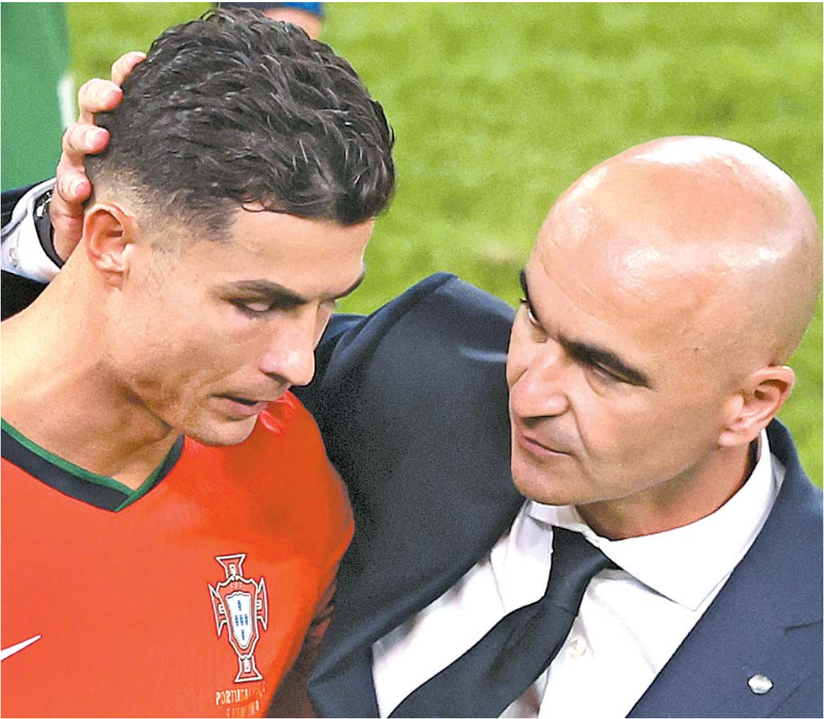
Cristiano Ronaldo se despediu da sua última Eurocopa sem nenhum gol marcado

Já a Suíça chegou na Eurocopa com dúvidas sobre o envelhecimento da geração. Mesmo assim, os suíços avançaram bem na fase de grupos e chegaram às quartas com uma vitória contundente diante da Itália, por 2x0.