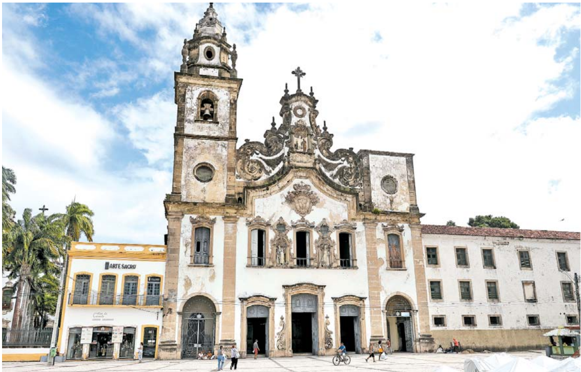
Imponente, Basílica do Carmo deverá estar repleta de fiéis durante os dez dias da Festa

Recife já respira o clima de fé com a chegada da 328ª edição da Festa do Carmo, que começa neste sábado e vai até 16 de julho, dia de Nossa Senhora do Carmo. Além das celebrações católicas, o evento também contará com apresentações musicais. As celebrações vão acontecer tanto na Basílica do Carmo quanto na Igreja da Ordem Terceira do Carmo, além do Claustro do Convento, que ficam no bairro de Santo Antônio, área central do Recife. Promovida pela Província Carmelitana Pernambucana e a Ordem dos Irmãos da Bem Aventurada Virgem Maria do Monte Carmelo, a festividade este ano tem como tema “Esperança dos Carmelitas... Peregrina conosco, em oração, rumo ao Jubileu” e o lema “Permaneciam unânimes na oração, Maria, a mãe de Jesus, e seus irmãos”. Segundo o reitor da Basílica do