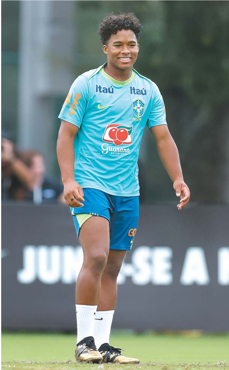
Endrick foi o escolhido de Dorival para substituir Vinícius Júnior contra Uruguai

O Canadá será o adversário da Argentina em uma das semifinais da Copa América 2024. A equipe empatou em 1x1 no tempo normal com a Venezuela, ontem, em Dallas. Nas penalidades, os canadenses venceram por 3x2.