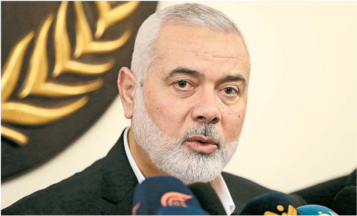
Ismail Haniyeh, 61 anos, liderava as ações do movimento e vivia entre a Turquia e o Catar

O líder do Hamas, Ismail Haniyeh, morreu ontem (31) em Teerã em consequência de um bombardeio atribuído a Israel tanto pelo movimento palestino como pelo Irã, que prometeram vingança. O temor agora é de que a guerra em Gaza se espalhe pelo Oriente Médio. O guia supremo iraniano, aia-