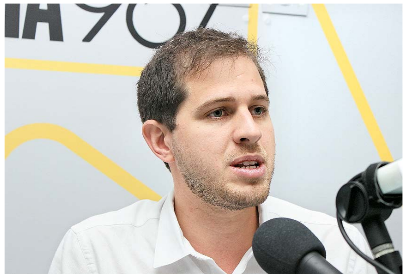
Deputado ainda falou sobre as perspectivas do PSB no pleito

Irmão do prefeito do Recife ressaltou as insatisfações que vem ouvindo de prefeitos sobre obras que foram iniciadas, mas não concluídas pelo Governo do Estado