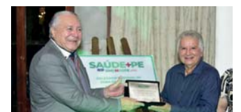
Nomeação da subsele de Goiana