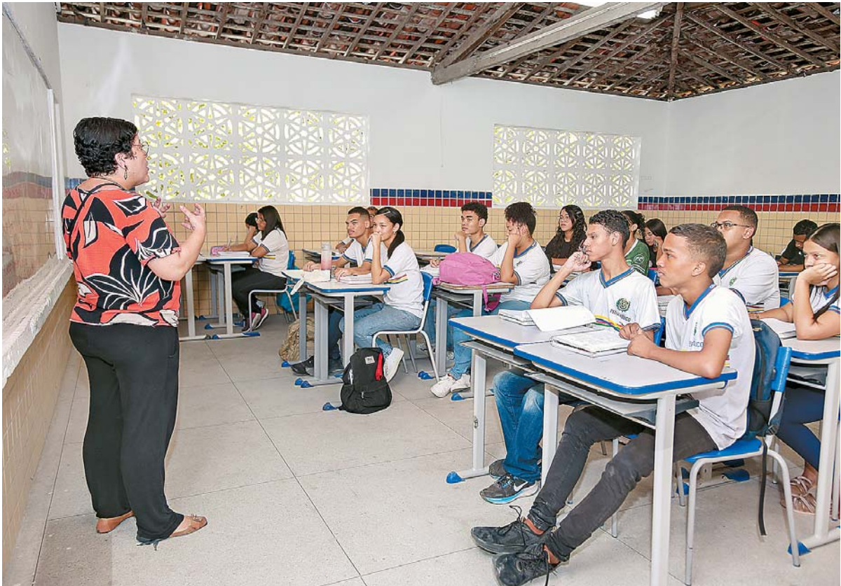
As alterações nas regras foram aprovadas no Congresso em julho, após meses de debate

Presidente Lula decidiu vetar a inclusão de conteúdos dos itinerários formativos específicos no Enem. Mudanças passam a valer a partir de 2025