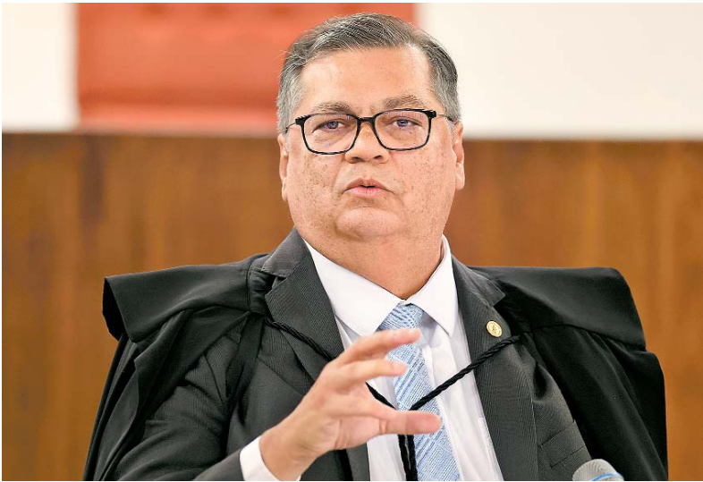
Para ministro, sem transparência danos podem ser irreparáveis

Parlamentares só poderão destinar recursos para os estados pelos quais foram eleitos. A medida foi tomada depois de uma audiência de conciliação sobre o chamado 'orçamento secreto'