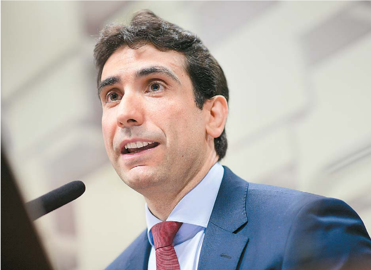
Caso seja efetivamente nomeado, Galípolo ficará no cargo de presidente por quatro anos