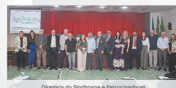
Diretoria do Sindhospe e Patrocinadores