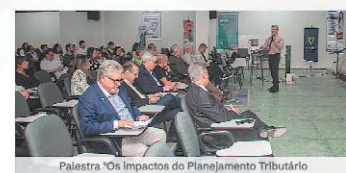
Palestra "Os Impactos do Planejamento Tributário para as Empresas de Saúde"

De 09 a 13/09/2024 o SINDHOSPE realizará sabatina com candidatos à prefeitura do Recife