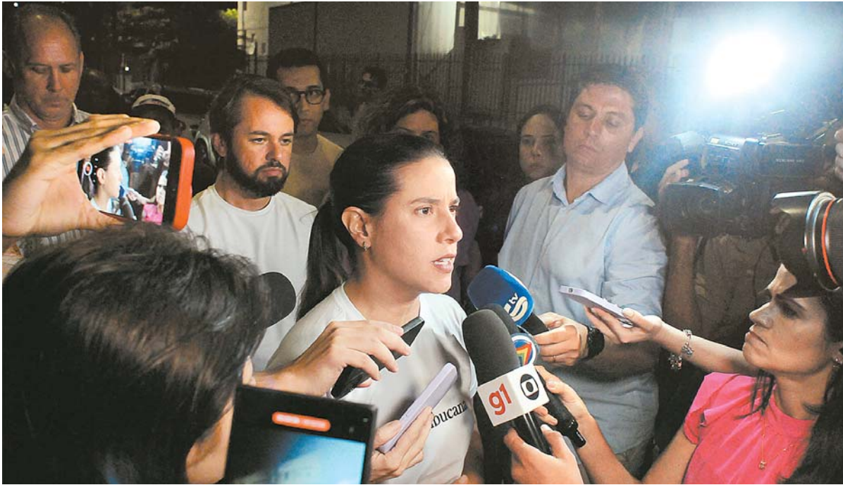
Governadora: “O nosso sonho, o de todos, é reerguer a igreja antes do 8 de dezembro”

trução. “Um Termo de Fomento será feito e a gente vai repassar os recursos, dando todo o apoio técnico para que os nossos engenheiros possam ajudar no novo projeto para a igreja. Iremos também fazer o trabalho dos laudos, das investigações para identificar a razão do que aconteceu aqui e garantir também o processo de reconstrução da igreja”, informou a governadora.