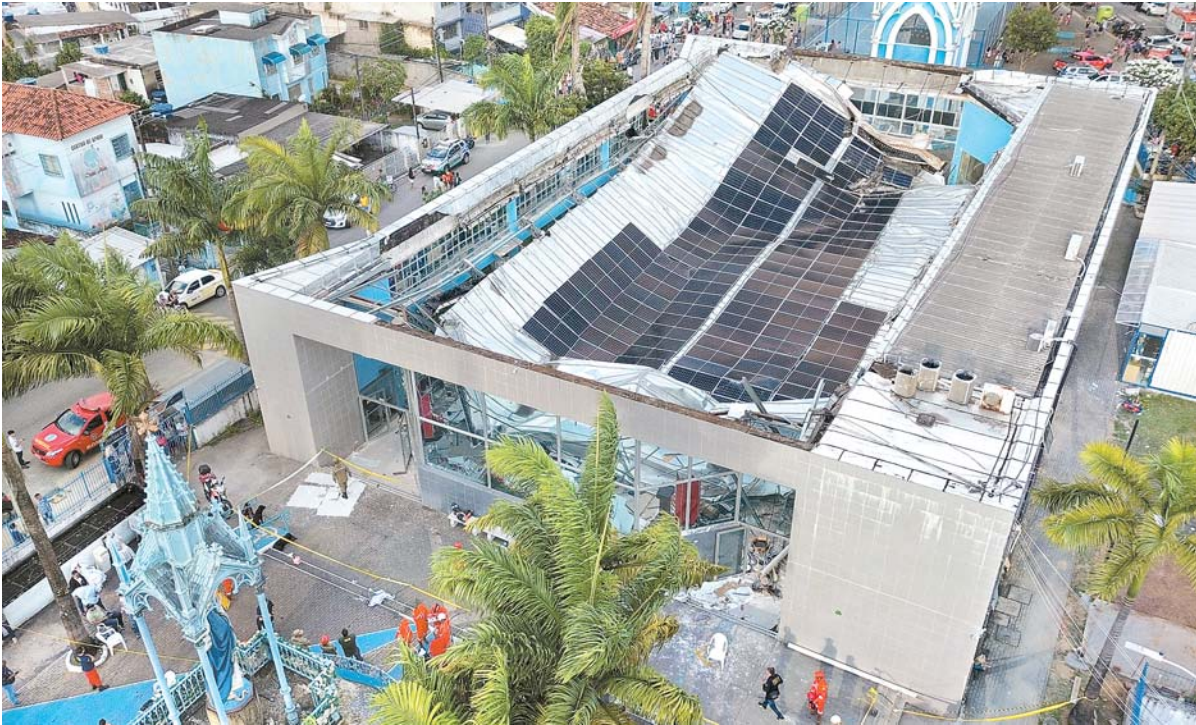
Estrutura havia recebido a instalação de placas de energia solar seis dias antes do ocorrido