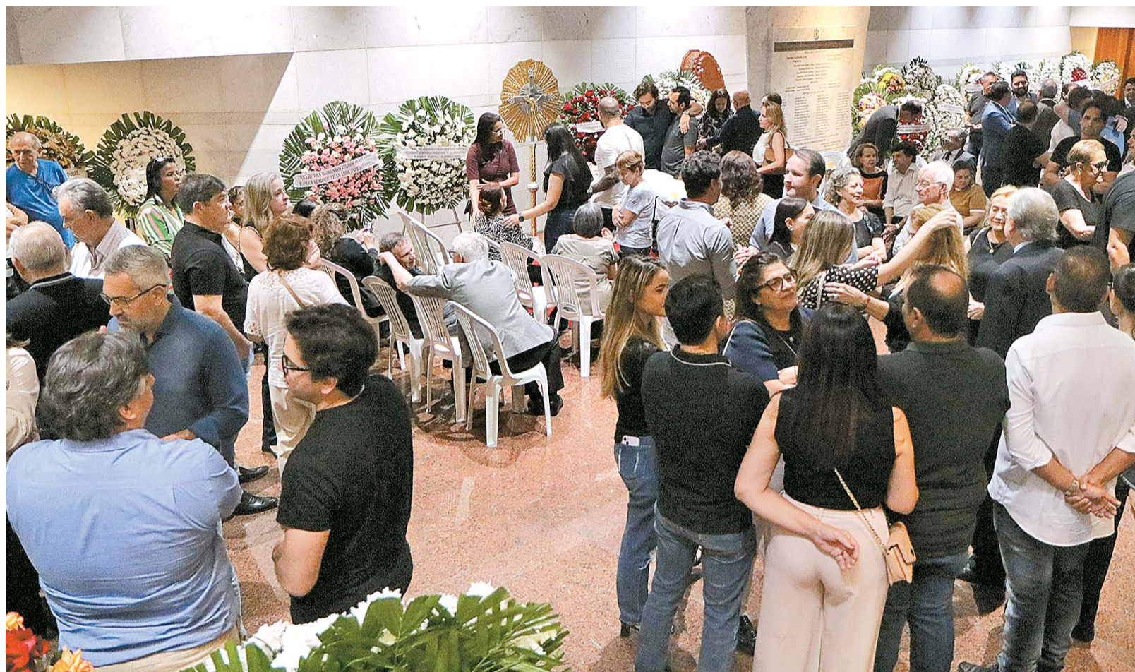
Autoridades públicas, lideranças empresariais, familiares, admiradores e amigos se reuniram para se despedir do ex-deputado