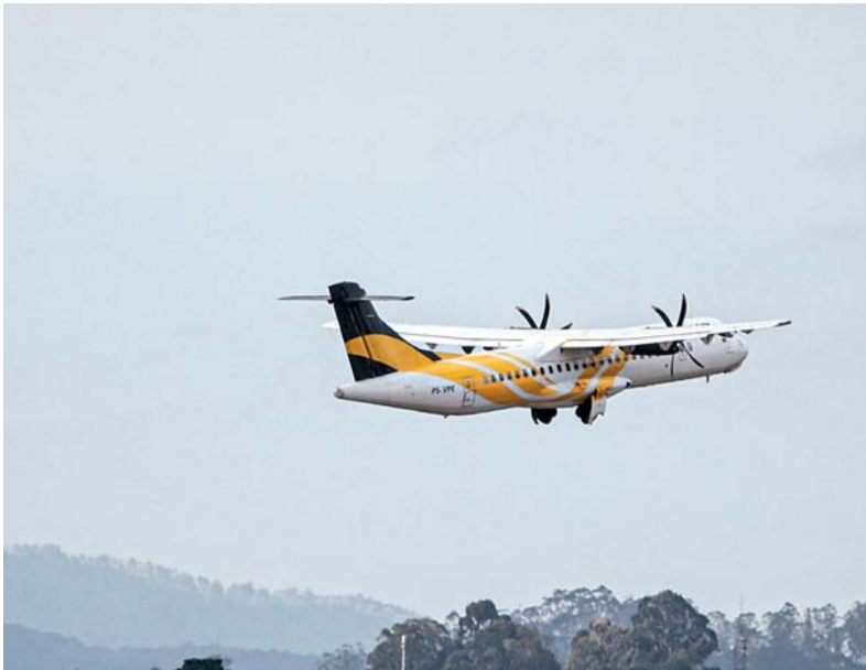
No site da Voepass as simulações para a ilha estão restritas

Simulações entre a rota que integra cidades de Fortaleza, Juazeiro do Norte (CE), Natal (RN) e a ilha pernambucana, constam como “indisponíveis” até 31 de agosto