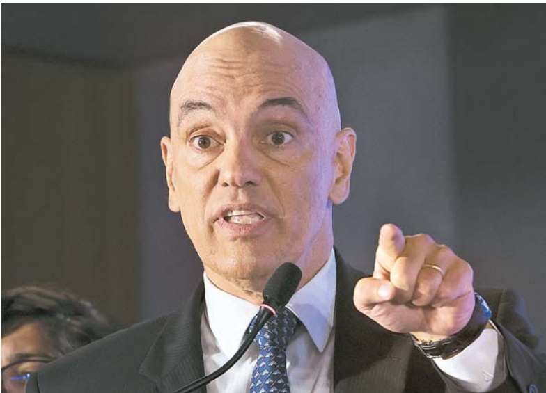
Ministro diz que “não há nada a esconder”, sobre pedidos ao TSE