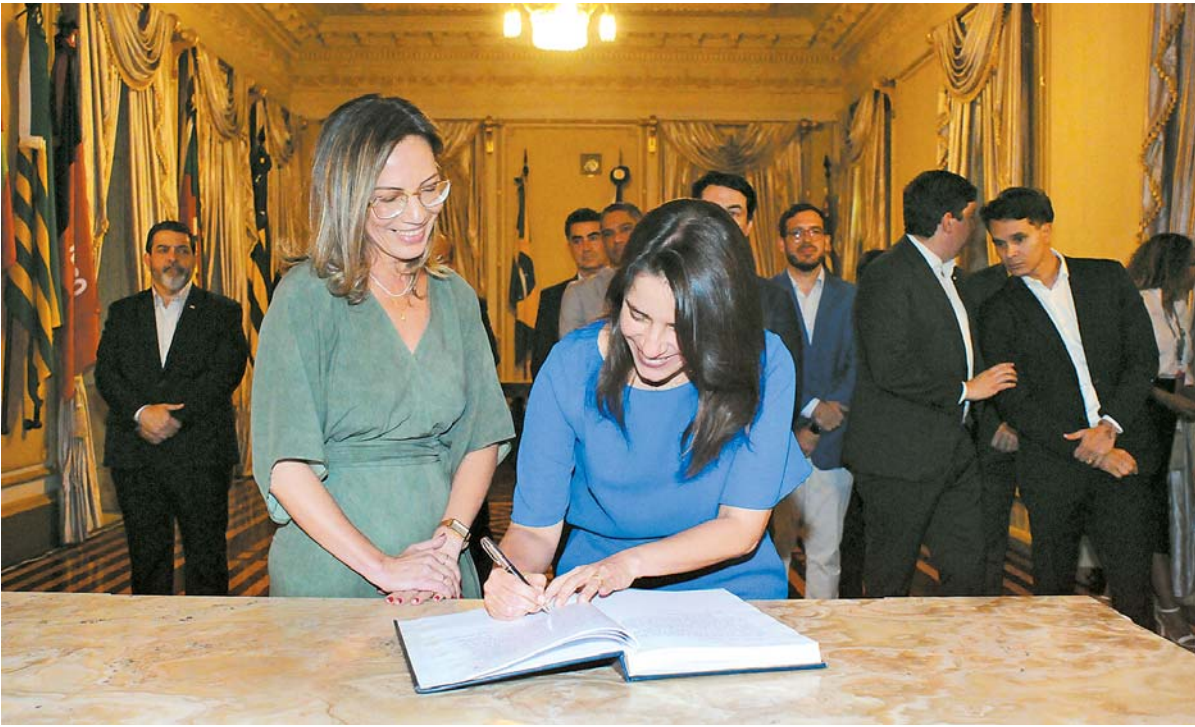
Governadora Raquel Lyra empossou nova secretária e reforçou a parceria com o PV

gas reais e a capacidade de articulação, de debate com a sociedade, de construção coletiva através dos nossos conselhos, do diálogo com o Terceiro Setor, porque esse é um tema (criança e juventude) que afeta todos nós”, disse a governadora.