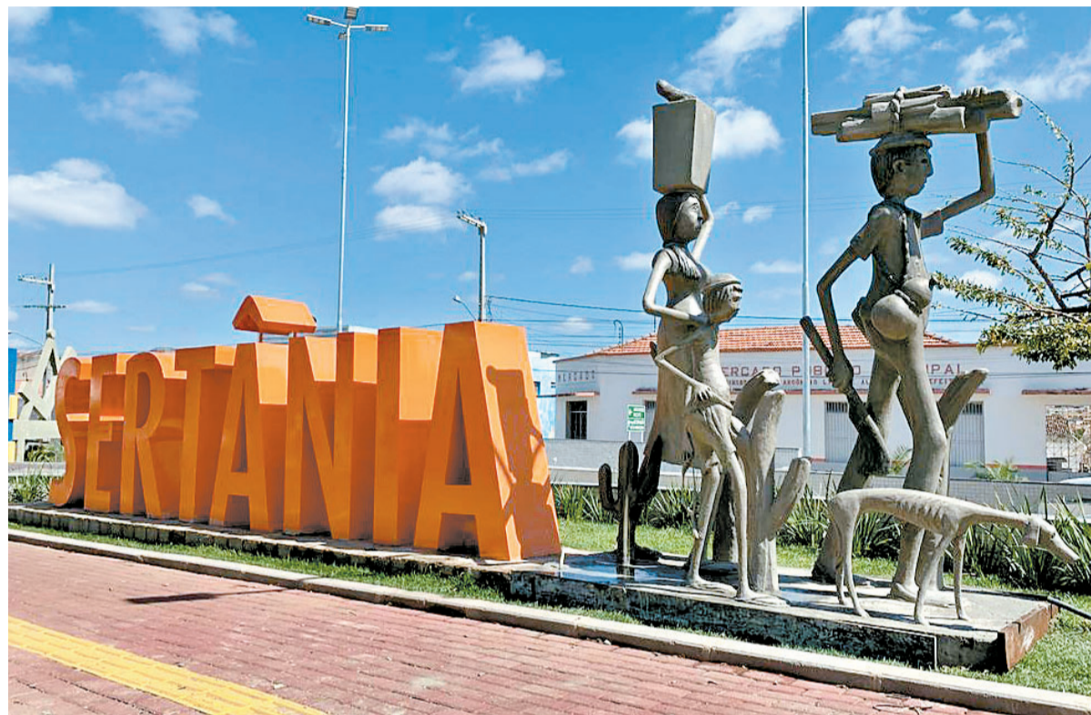
Sertânia foi escolhido para receber novo campus da UFPE pela “localização estratégica”