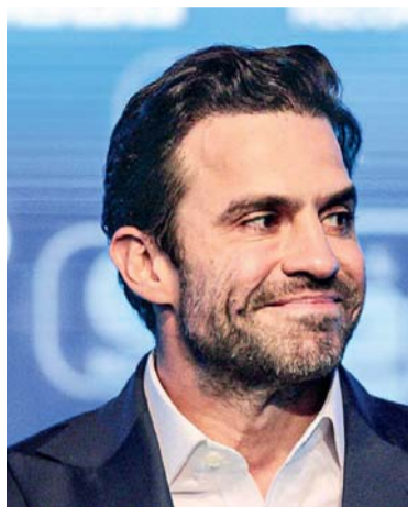
Pablo Marçal negocia sua filiação ao União Brasil