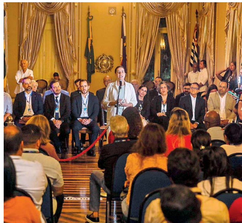
Raquel assina os contratos para os novos habitacionais

A governadora de Pernambuco, Raquel Lyra, assinou ontem (7) contratos para viabilizar a construção de 272 unidades habitacionais destinadas a famílias de baixa renda no Recife e em Pesqueira, no Agreste do Estado. A cerimônia ocorreu no Palácio do Campo das Princesas, como parte do Programa Morar Bem PE em parceria com o Minha Casa, Minha Vida - Fundo de Arrendamento Residencial (FAR).