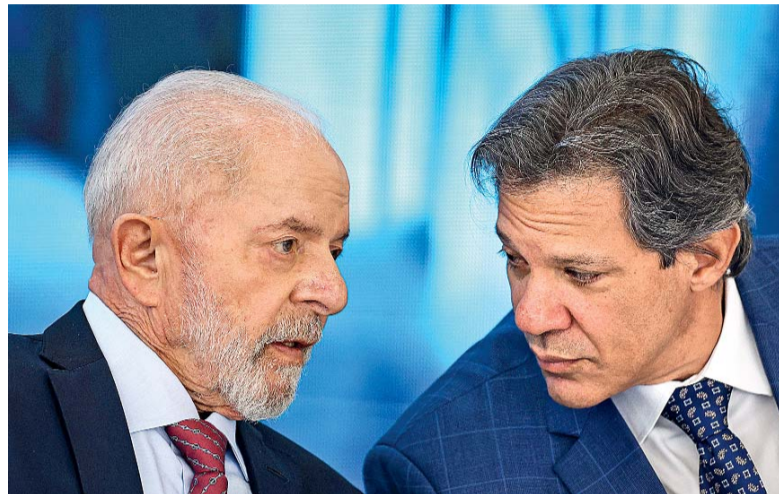
Lula busca consenso e Haddad defende contingenciamento