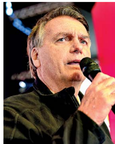
Ex-presidente aposta na reversão de inelegibilidade