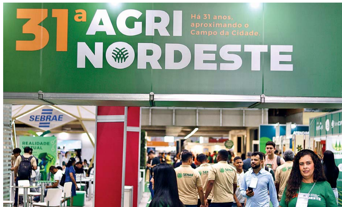
Os organizadores da Agrinordeste aguardam um público estimado em 30 mil pessoas