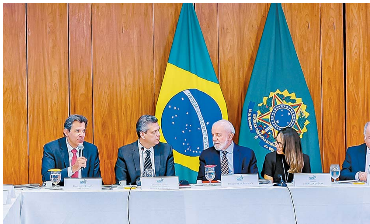
Após reunião, Fernando Haddad não revelou qual o ministério foi escolhido pelo presidente

O chefe da pasta da Fazenda informou ainda que já tem conversa com os presidentes da Câmara dos Deputados, Arthur Lira (PP-AL), e do Senado, Rodrigo Pacheco (PSD-MG), sobre o teor das medidas.