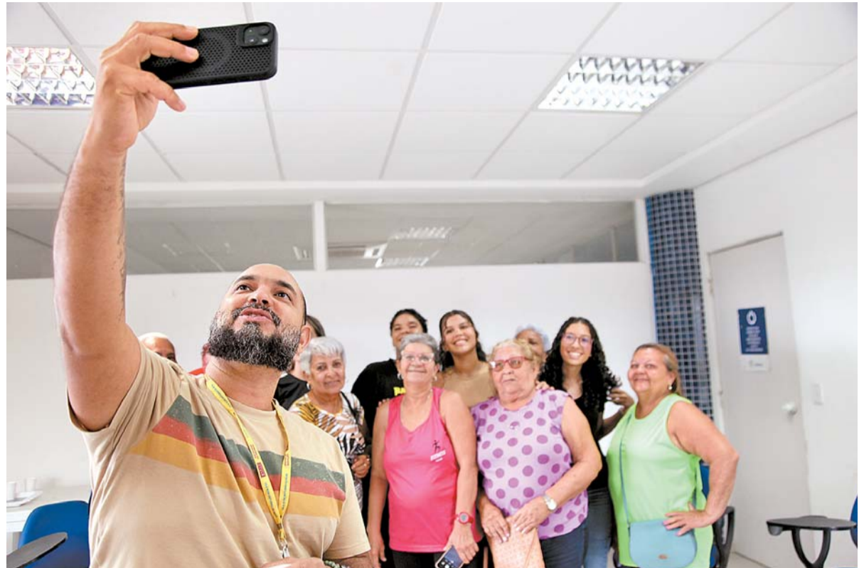
No primeiro dia de aula, professores dialogam com participantes para entender principais dúvidas

A Rede Compaz começou na manhã de ontem, no Recife, um projeto que oferece uma série de aulas gratuitas para idosos aprenderem a usar celular. A ação faz parte do Viva Mais Cidadania, é gratuita e está disponível nas unidades Leda Alves (Pina), Paulo Freire (Ibura) e Eduardo Campos (Alto Santa Teresinha). São ofertadas 25 vagas por local.