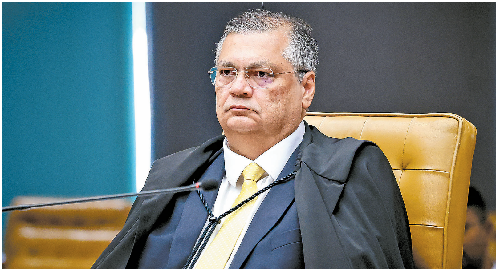
Dino deu prazo para a Casa esclarecer o pagamento de emendas parlamentares, que estão suspensas por decisão do ministro

Em resposta ao ministro Flávio Dino, Casa legislativa diz que líderes agiram dentro da lei ao indicar emendas de comissão. Magistrado do STF suspendeu pagamento de R$ 4,2 bilhões