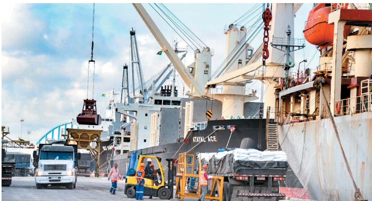
De 2023 até hoje, o terminal faturou mais de R$ 88 milhões, um crescimento de 48,27%