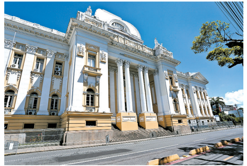
A previsão do TJPE é que a execução ocorra em cinco anos