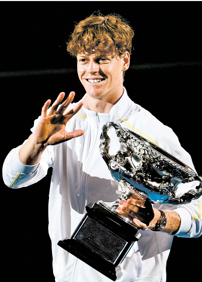
Com apenas 23 anos, Sinner é o tenista número 1 do mundo

Dominado em quadra, em Melbourne, o número 2 do mundo disse que fez o que podia. "Eu não parei de lutar, não parei de acreditar, então, no terceiro set, ele (Sinner) foi ainda superior. É um momento difícil porque pensei que tinha uma chance muito boa e estava me sentindo bem. Ver alguém levantar o troféu e eu de pé ao lado pela terceira vez é difícil", comentou. "Jannik é melhor do que eu no momento. Simples assim."