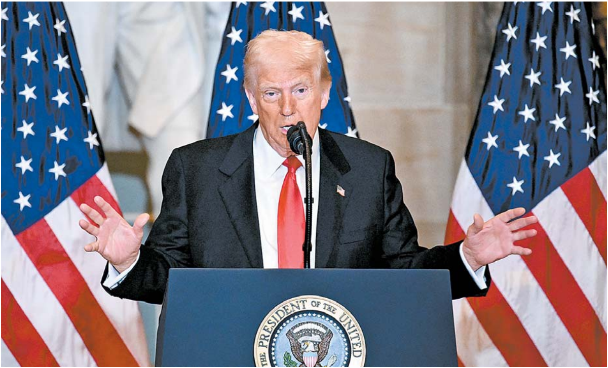
Justiça suspendeu ainda o prazo dado por Trump para demitir 2 milhões de funcionários

Presidente dos Estados Unidos assinou ordem para retirar cidadania dos que nasceram no país, mas que são filhos de imigrantes. De acordo com o juiz John Coughenour, a medida é inconstitucional