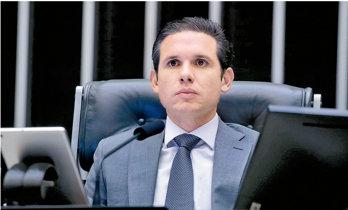
Número de subscrições aumentou após Hugo Motta defender modelo parlamentarista

A discussão ganha força em momento de conflito entre os Três Poderes sobre a execução do Orçamento da União. Nos últimos anos, principalmente durante a presidência de Arthur Lira (PP-AL) na Câmara, os parlamentares ganharam ainda mais poder sobre a destinação de emendas, o que enfraqueceu o Executivo. Mas esse mo-