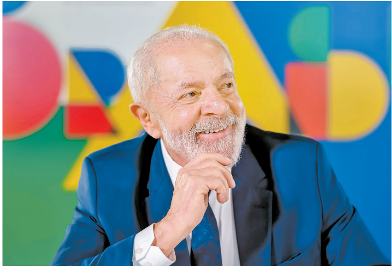
Lula: roteiro de viagens que visa reverter a curva negativa