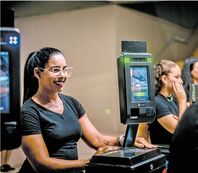
Jogo contra o Fortaleza já contou com acesso por biometria facial