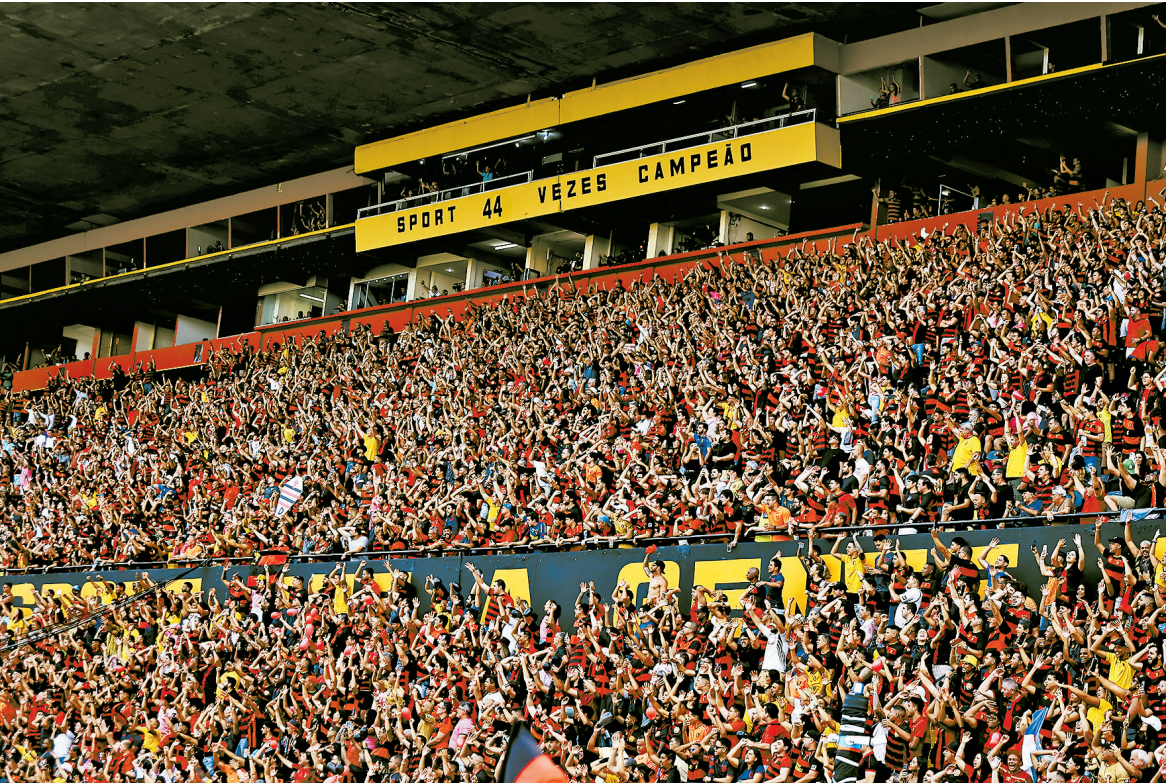
Ilha do Retiro será palco da partida derradeira do Campeonato Pernambucano 2025

A Federação Pernambucana de Futebol (FPF) confirmou ontem que o jogo da volta da final do Campeonato Pernambucano 2025, entre Sport e Retrô, na Ilha do Retiro, será no dia 2 de abril, às 21h30. O confronto de ida aconteceu no último sábado, na Arena de Pernambuco, com vitória do Sport por 3x2. O Leão precisa apenas de um empate para conquistar o tri-campeonato da competição. O Retrô precisa ganhar por dois gols de diferença para levar o Estadual pela primeira vez na história. Por um, a partida vai para as penalidades. O jogo estava agendado inicialmente para ocorrer amanhã, mas precisou ser adiado por conta do