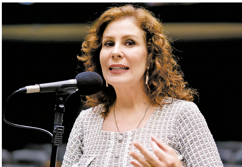
Deputada responde por porte ilegal de arma de fogo

Após o ministro Nunes Marques pedir vista e interromper julgamento, Zanin se antecipa e dá o 5º voto para condenar a deputada bolsonarista