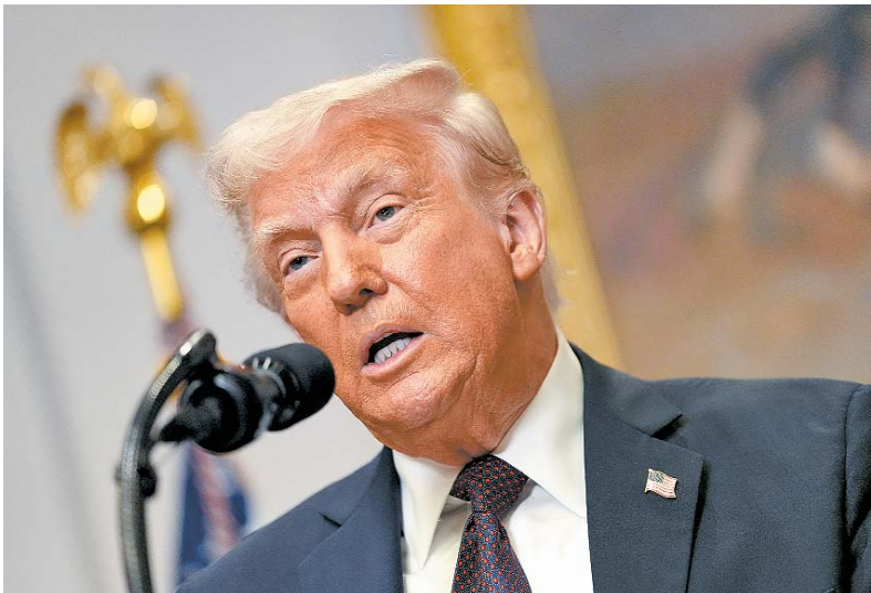
Trump considera regime de Maduro uma ameaça à segurança

Segundo a Casa Branca tarifa poderá ser imposta a partir de 2 de abril a todos os produtos importados para os Estados Unidos de qualquer país que importe petróleo venezuelano