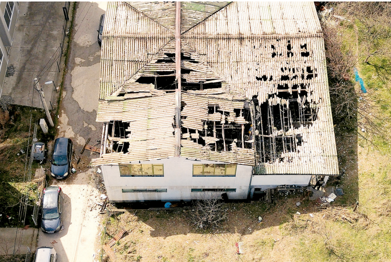
Faíscas de dispositivos pirotécnicos podem ter causado incêndio

De acordo com as autoridades, cerca de 155 feridos foram levados para hospitais em todo o país, sendo que 22 estão em estado crítico.