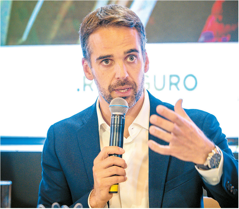
Eduardo Leite é apresentado como alternativa para 2026