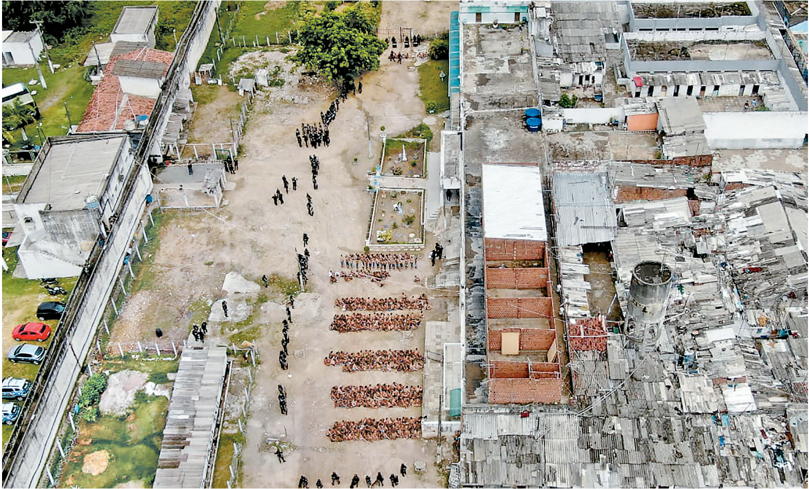
Desativada ontem, Penitenciária Professor Barreto Campelo funcionava há mais de cinco décadas na Ilha de Itamaracá