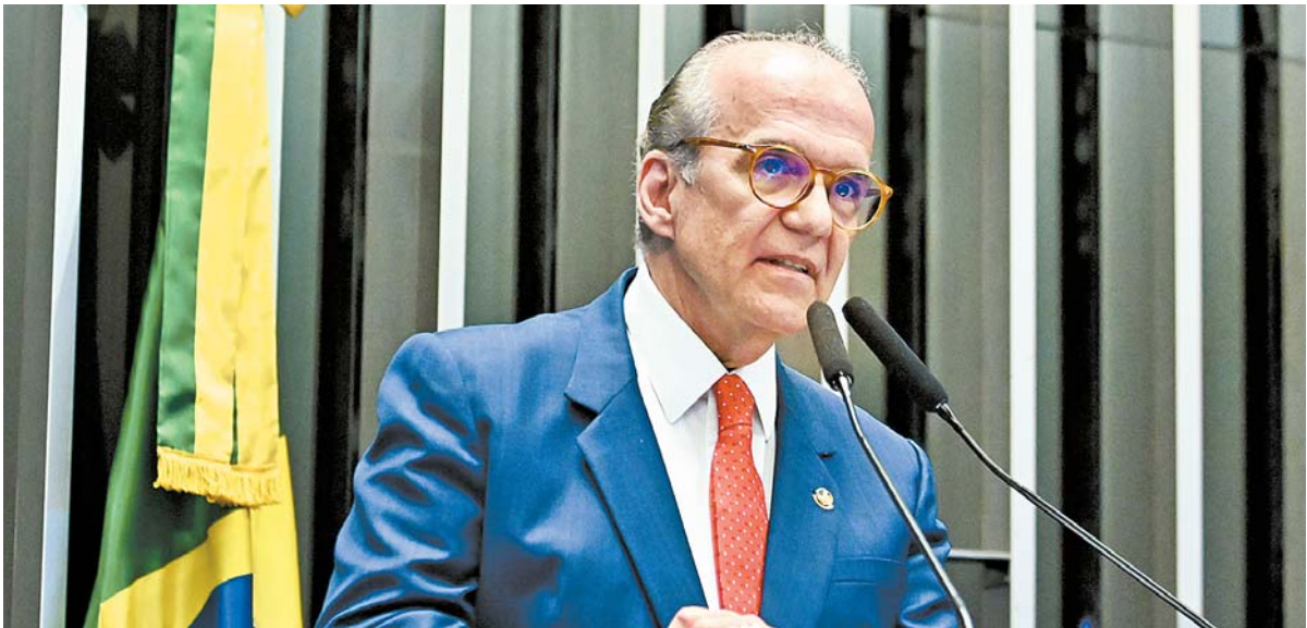
Proposta de Fernando Dueire inova na economia ambiental e na proteção dos recursos naturais

Iniciativa foi aprovada na Comissão de Infraestrutura da Casa Alta e regulamenta a securitização de ativos ambientais