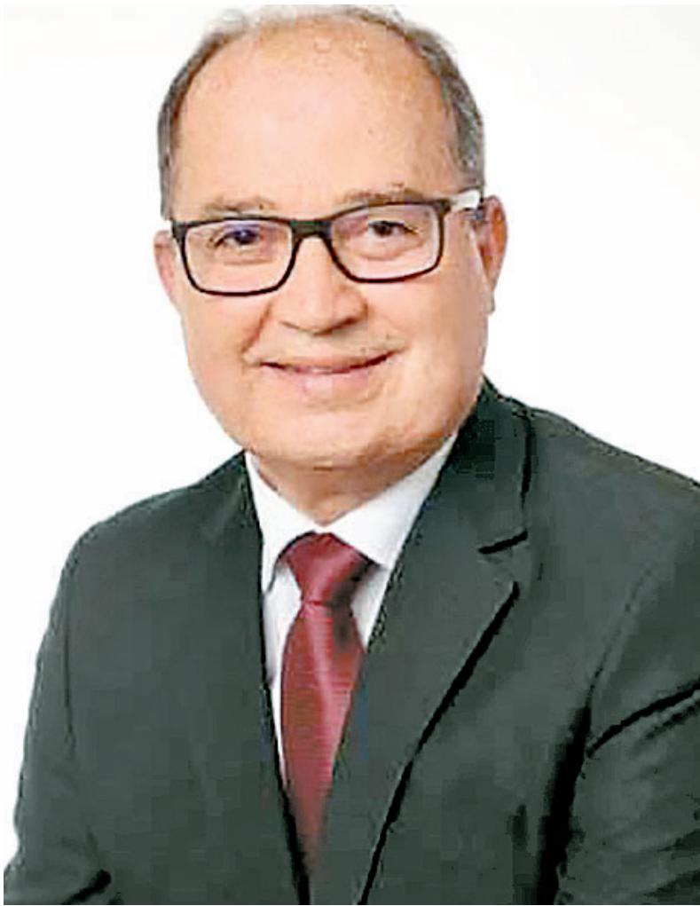
Para Martins, projeto promete fortalecer o debate político

A ideia de fazer direto de Brasília já é um diferencial. A capital da República concentra as decisões mais importantes do País, seja de natureza política ou econômica. Aliado a isso, Brasília é meu território de trabalho desde a época das Diretas já, o primeiro grande movimento de enverga-