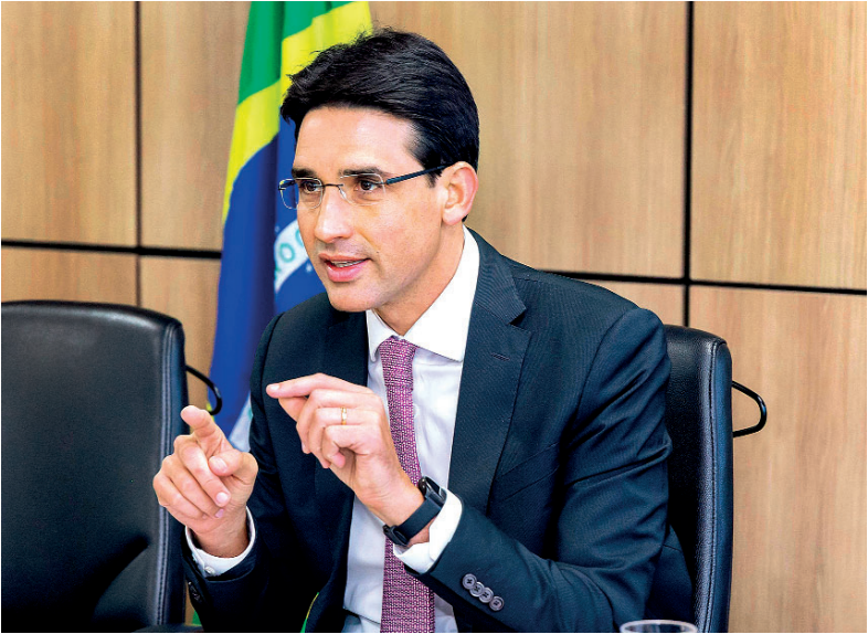
“Voepass está dialogando com companhias fora do Brasil”

Segundo Silvio Costa Filho, na primeira semana de maio, está prevista uma reunião para a Voepass apresentar um plano estratégico de fortalecimento da companhia