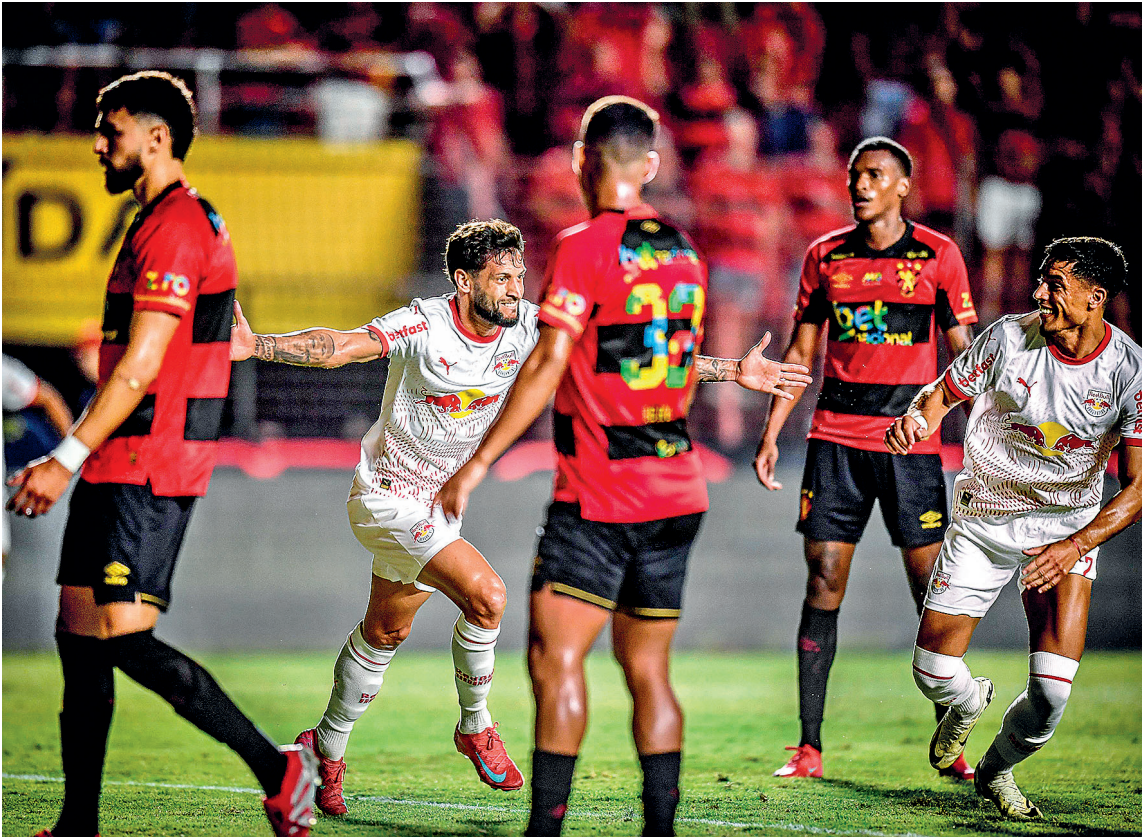
Rubro-negro acumulou mais uma derrota na pior atuação até aqui no Brasileirão

À frente no placar, o clube paulista não encontrava dificuldades para incomodar a zaga do Sport. Entre as raras tentativas dos donos da casa, duas saíram dos pés de Lucas Lima. Em uma delas, na sequência do lance, Du Queiroz chutou sobre o jogador adversário e o árbitro chegou a marcar pênalti, alegando toque de mão de Guzmán Rodri-