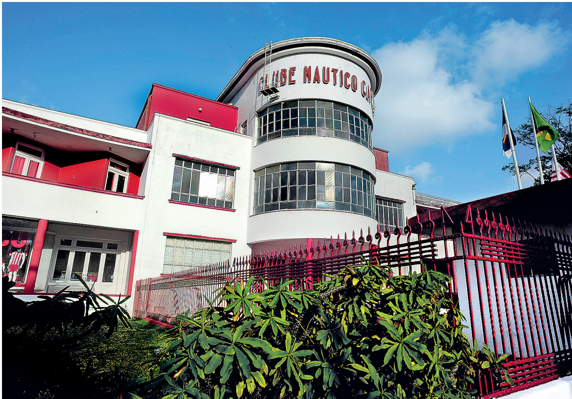
Caso negociação avance, proposta seria levada para votação no Conselho Deliberativo

Conselho Deliberativo do Náutico ainda não recebeu resposta dos investidores sobre questionamentos da SAF. Prazo inicial da devolução terminou no final de semana passado