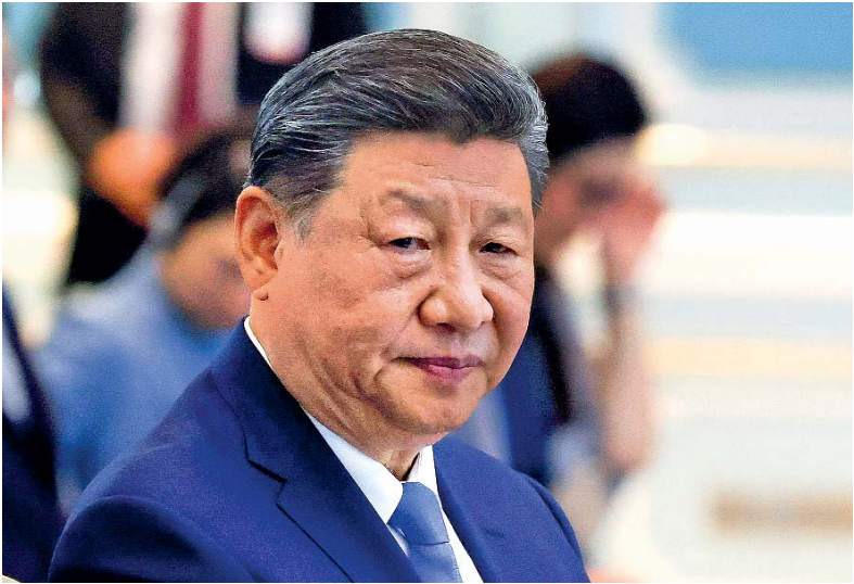
Em nota, Xi Jinping critica EUA pela imposição de tarifas

Conselho de Segurança da ONU para acusar os Estados Unidos de 'bullying' e de "lançar uma sombra sobre os esforços globais pela paz e desenvolvimento" ao usar tarifas como arma. A reação se dá um dia depois de a Casa Branca veicular um comunicado oficial no qual afirma que o país de Xi Jinping enfrentará tarifas ainda maiores, de até 245%, por causa das “ações retaliatórias”. “Todos os países, especialmente os em desenvolvimento, são vítimas do unilateralismo e das práticas de bullying”, diz a nota conceitual da reunião informal da ONU sobre “o impacto do unilateralismo e das práticas de intimidação nas relações internacionais”. A nota, que convida todos os 193 Estados-membros da ONU a participarem da reunião de 23 de abril, critica especificamente os