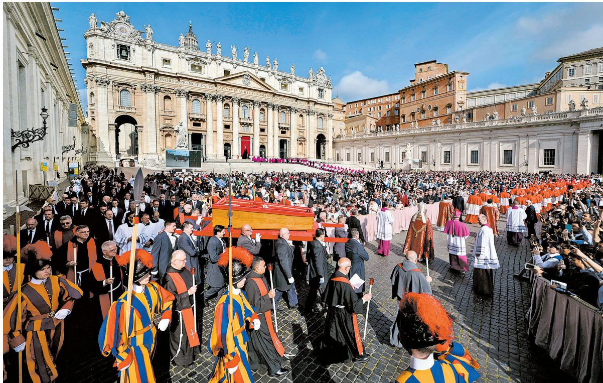
Do lado de fora da Basílica de São Pedro, muitos esperaram até oito horas para se despedir