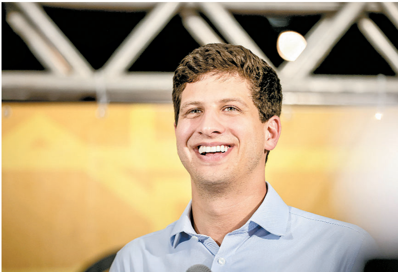
Gestor disse que posição é clara e unificada no partido

betaniasantana@folhape.com.br / A coluna de Betânia Santana é publicada de terça a sábado.