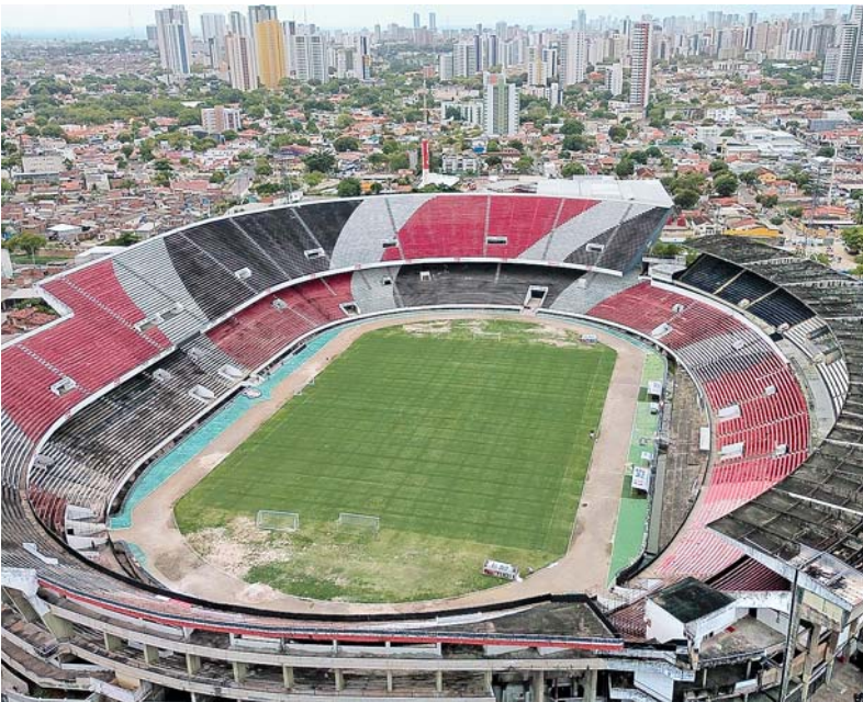
Medida visa garantir segurança para a entrada no local