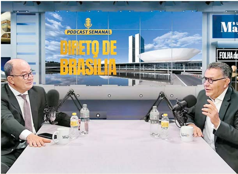
Dirigente criticou o PT por não renovar seus quadros