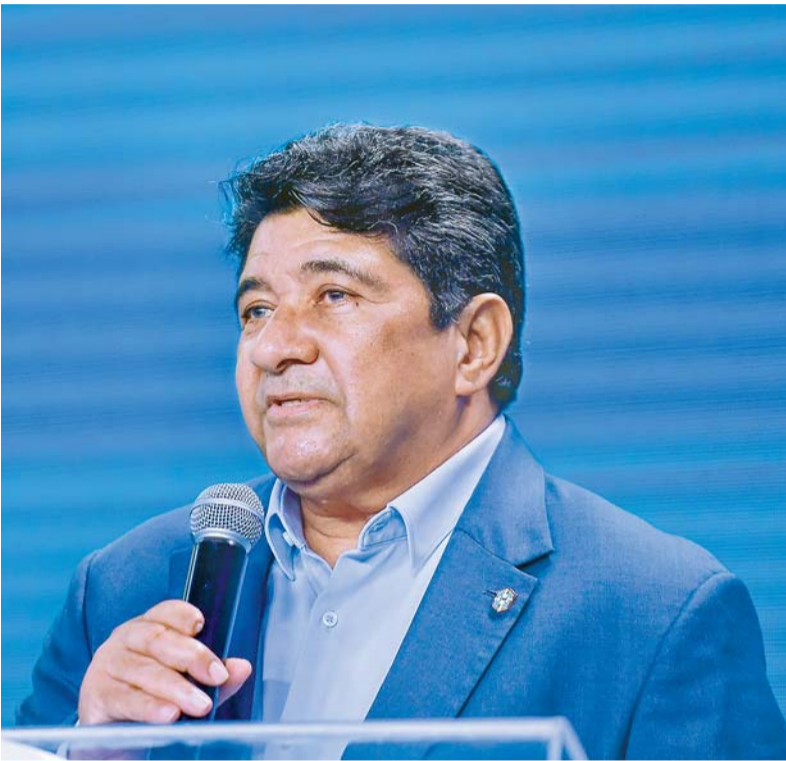
Ednaldo ainda utilizou a petição para desejar sucesso a Samir Xaud

O recurso havia sido feito na última quinta-feira, mesmo dia em que o Tribunal de Justiça do Rio de Janeiro (TJRJ) decidiu por afastar Ednaldo Rodrigues. Era pedido que o STF impugnasse a decisão.