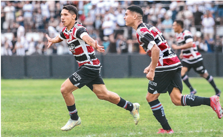
Santa Cruz soma quatro vitórias e um empate na Série D

Ambos os times venceram quatro confrontos e empataram um. Até o saldo de gols é parecido, mas com o Tricolor marcando nove e sofrendo dois e o time alagoano marcando dez e sofrendo três. Caso conquiste mais uma vitória ou até mesmo um empate, a Cobra Coral vai superar a sequência que teve no Campeonato Pernambuca-no, quando venceu Retrô, Sport, Ja-guar e Central, consecutivamente, além de ter ficado no empate com o Maguary. Naquele momento, o retrospecto positivo só foi inter-rompido nos clássicos contra o Sport, na semifinal do Estadual: 2x0 na ida e 1x0 na volta para o time rubro-negro.