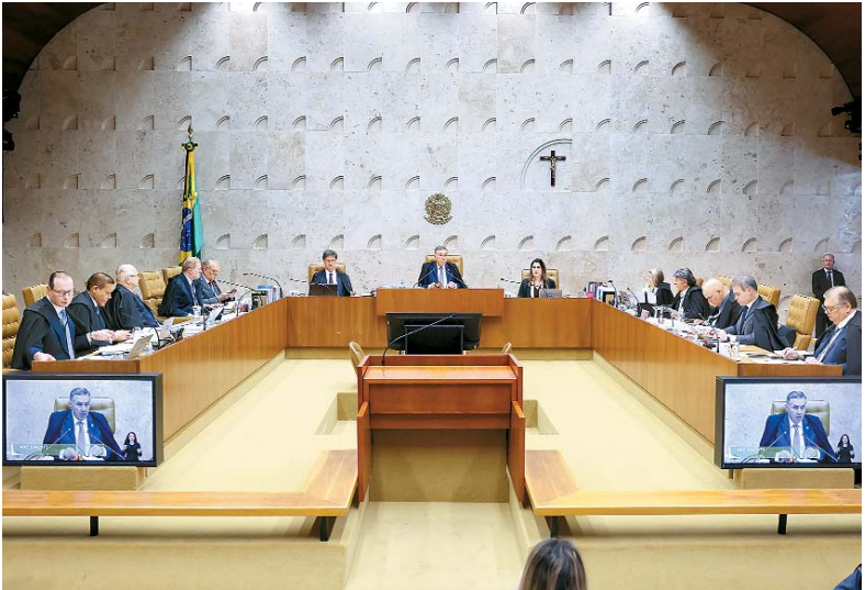
Corte decidiu, por unanimidade, manter entendimento do TSE

cumento que impede o registro de candidaturas.