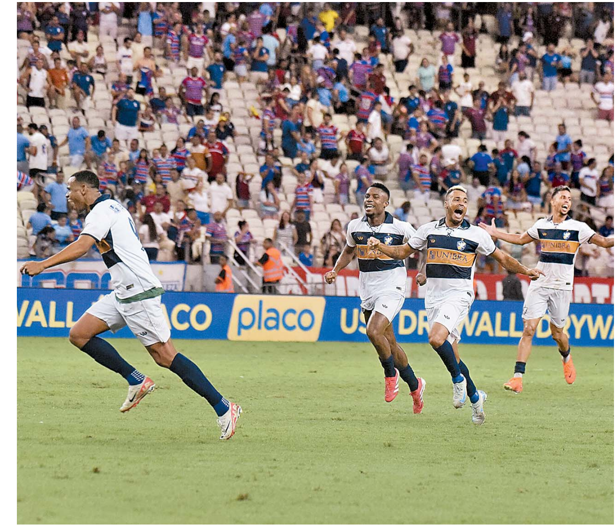
Retrô faz bonito no Castelão e se torna único time pernambucano vivo na Copa do Brasil

Enquanto o Retrô voltou para o segundo tempo com Fialho na vaga de Maycon Douglas, o Fortaleza manteve a formação inicial, mas mudou a postura. Passou a rondar mais a zaga da Fênix e aca-