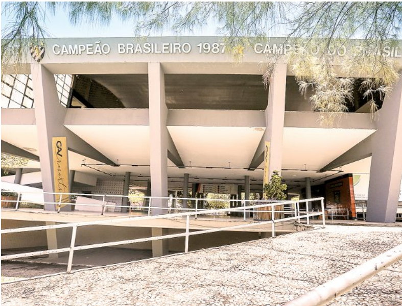
Rubro-negro divulgou balanço financeiro na última quarta

“Nossa gestão tem se pautado muito pelo rigoroso cuidado com as contas do clube. É um princípio primordial para gerir um gigante como o Sport e essa máxima se aplica ainda mais quando relembramos a maneira como assumimos o Sport. Em comparação com o retrato atual, sem dúvidas vivemos um outro momento, mas temos um caminho ainda a percorrer e buscamos isso diariamente em nosso trabalho”, destacou o