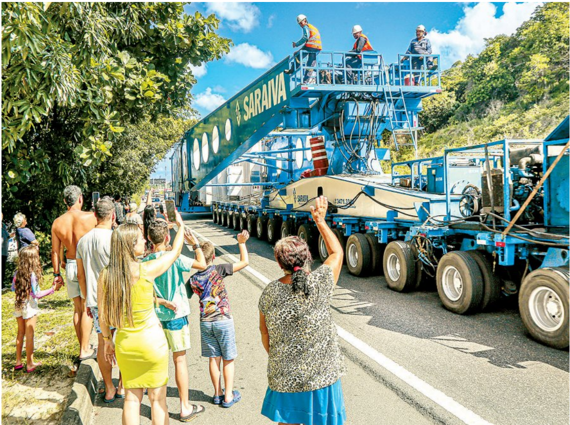
Público acena durante passagem da escolta do transformador de energia pelo Recife

GABRIELA CASTELLO BUARQUE E CÉSAR GABRIEL