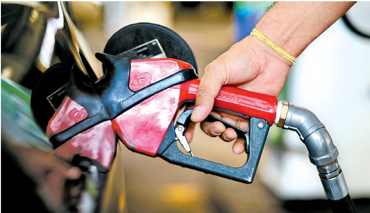
Especialistas alertam que impacto real no preço ao consumidor final pode sofrer variação

Combustível estava há 328 dias sem reajuste. No fechamento do último dia 30, o preço médio nas refinarias da Petrobras era de 3% acima do praticado no mercado internacional