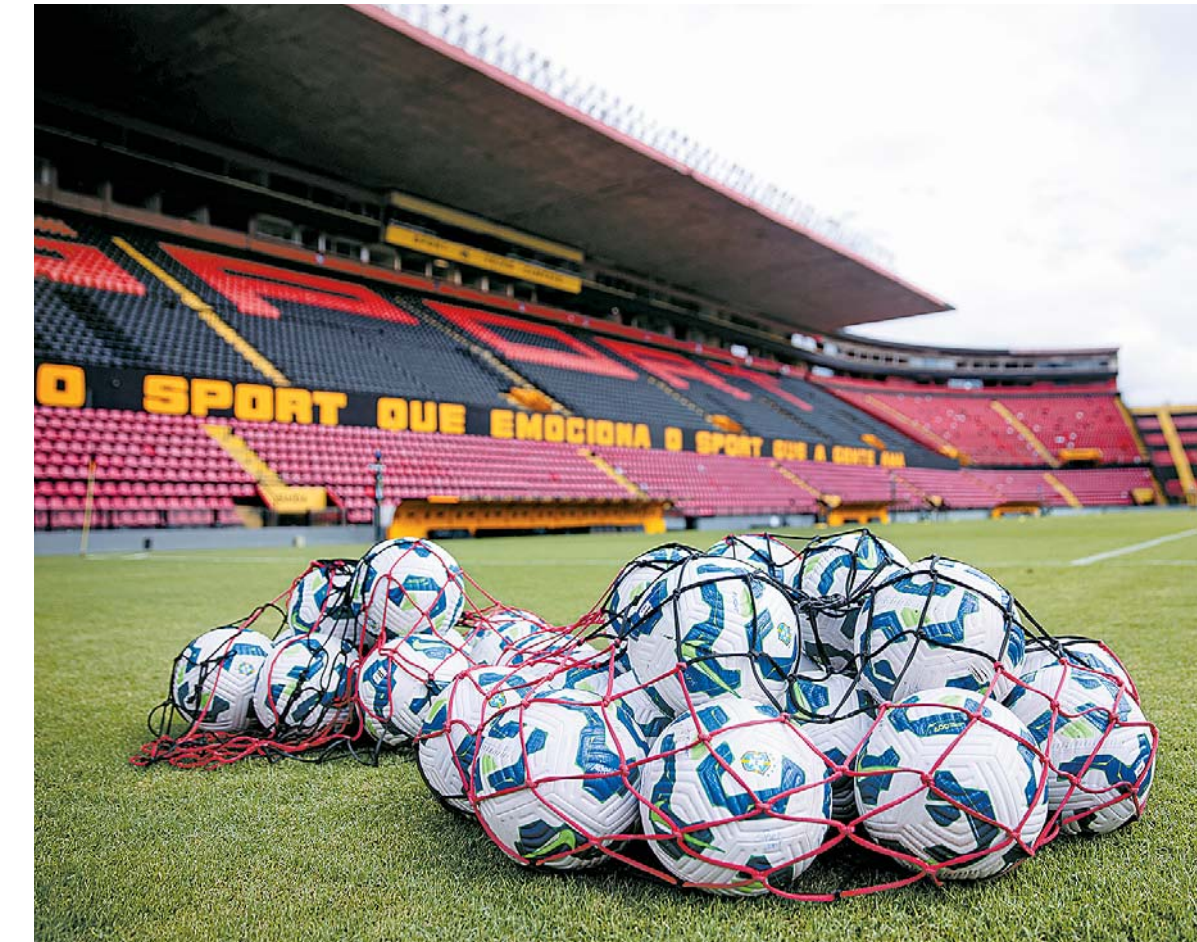
Rubro-negro volta a campo apenas no dia 13 de julho, quando enfrenta o Juventude

O clube afirmou que está seguindo recomendação da Confederação Brasileira de Futebol (CBF) que orienta a concessão de um período de recesso para todos os