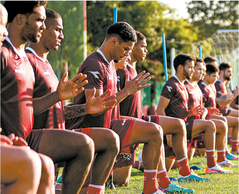
Alvirrubros enfrentam o Tombense, domingo, pela 10ª rodada

Observando os extremos da tabela, o Náutico está um ponto atrás do Ituano, em oitavo e primeiro integrante do G8. O clube tem quatro a mais do que o Retrô, 17º e equipe que abre a zona de rebaixamento.