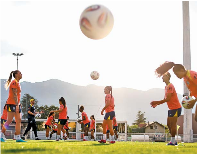
Ontem, foi o segundo treino com todas as 23 convocadas

Seleção feminina de futebol enfrenta hoje a equipe francesa em último amistoso antes da estreia na Copa América