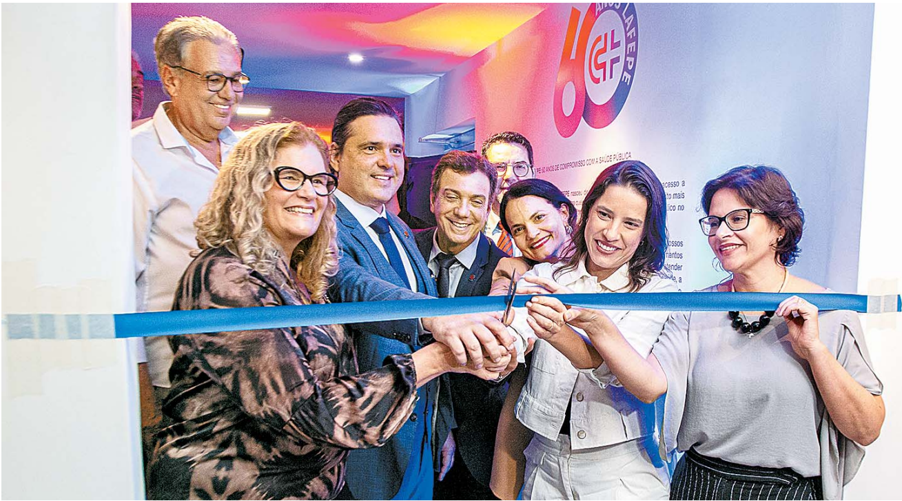
Corte coletivo da fita inaugural do novo espaço, que marca a história do laboratório farmacêutico de Pernambuco

A governadora, aproveitando a ocasião, revelou que o estado está fazendo seu maior investimento da história e que o laboratório é um importante braço do sistema público de saúde. “Agora o investimento é de R$ 259 milhões, é a nova etapa de expansão do Lafepe, equando a gente entra numa grande nova estratégia do governo Federal para que, dentro do complexo da indústria farmacêutica,