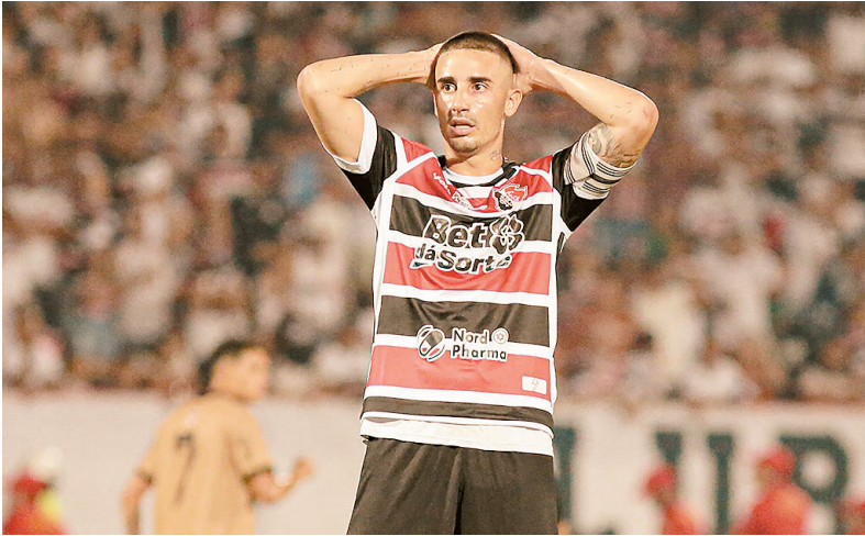
Após derrota, Cobra Coral joga dia 6, contra o América-RN

ruaru quebrou um tabu de 14 anos sem vencer o Santa no Recife.