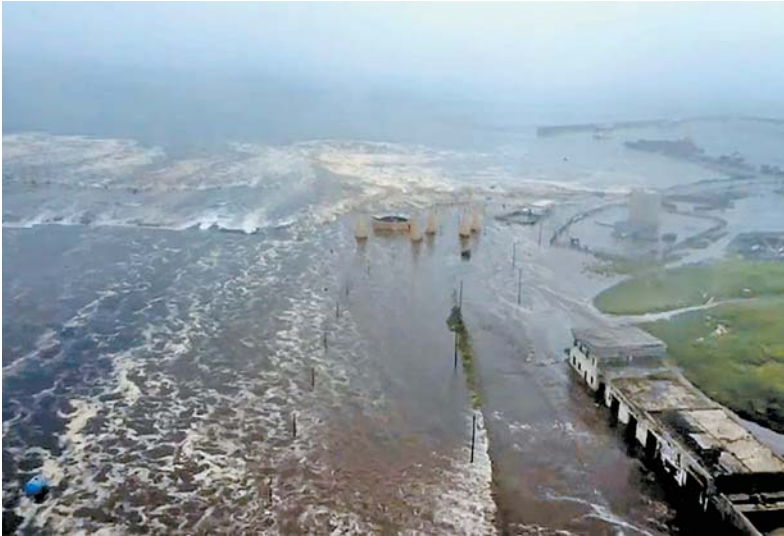
A cidade de Severo-Kurilsk foi fortemente atingida

Quatro ondas de tsunami atingiram a cidade de Severo-Kurilsk. Cientistas estimam que tremores secundários devem ocorrer por cerca de um mês