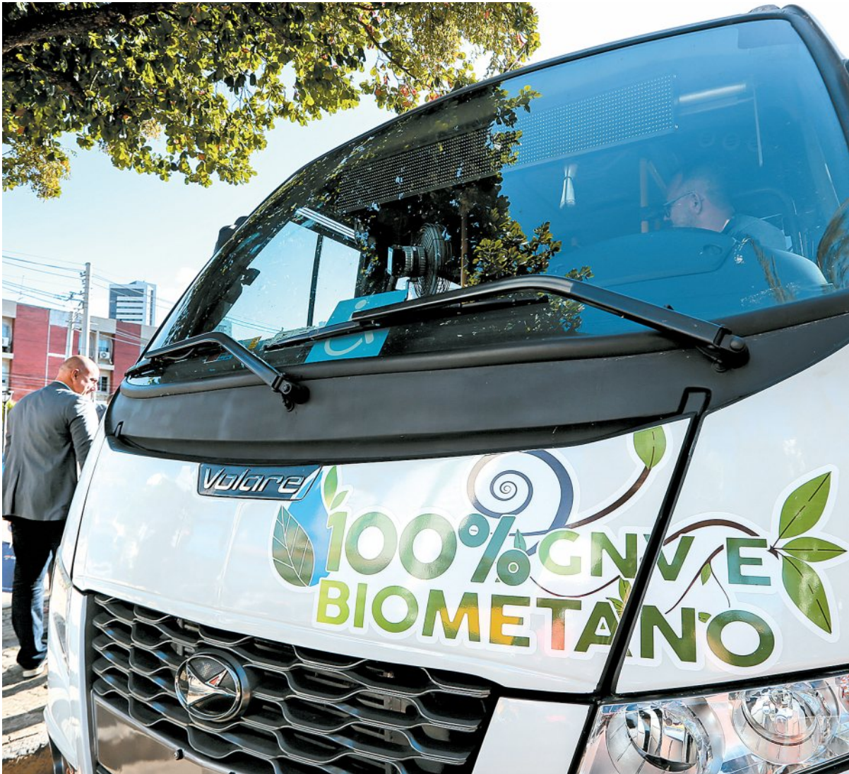
Iniciativa integra as estratégias de incentivo ao avanço da transição energética