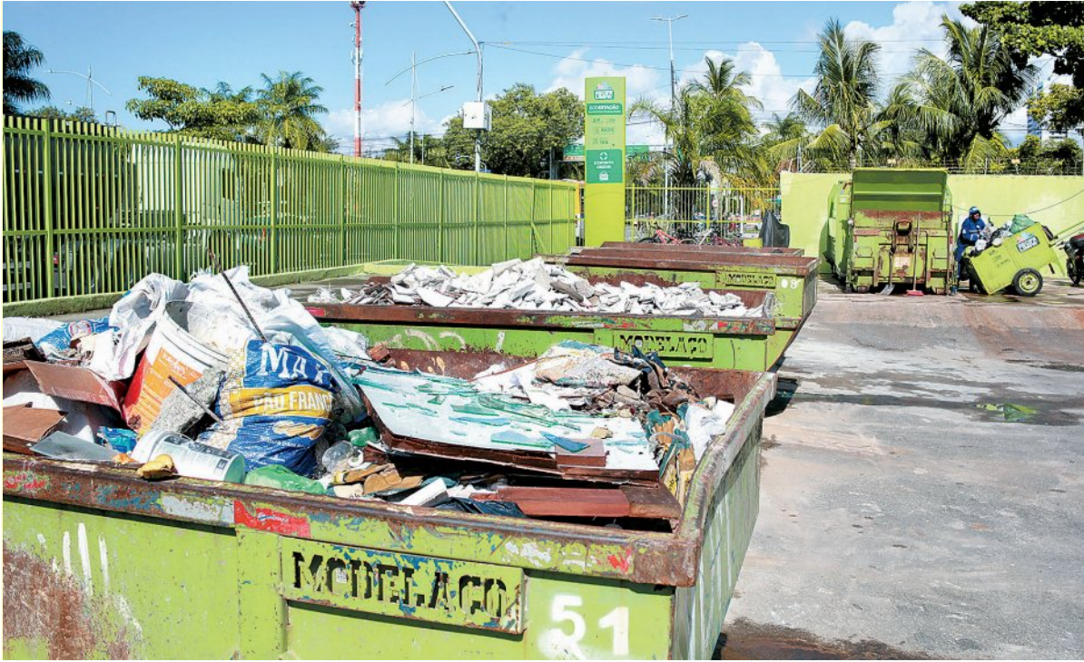
Ecoponto da Ecoestação Campo Grande funcionará de segunda a sexta, das 8h às 17h