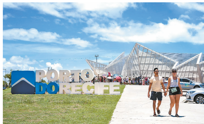
Ancoradouro sedia palestras voltadas para a inclusão social