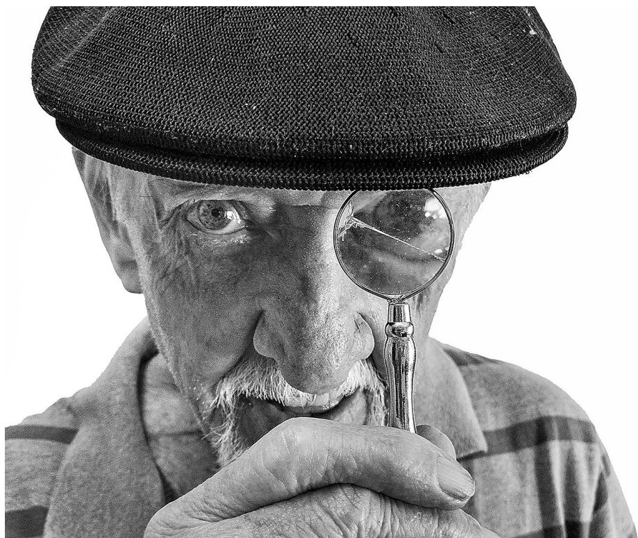
Autor de um traço inconfundível, iniciou sua carreira desenhando na revista Manchete em 1952